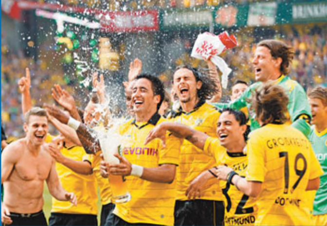
■年輕當打的多蒙特提前兩輪登德甲王座。

慢慢走出低谷的衛冕冠軍拜仁慕尼黑隊本輪繼續了復甦的勢頭，當日以4:1大勝史浩克04隊，送給了對手自歐聯準決賽以來的又一場敗績。憑藉此勝利，拜仁成功超越本輪0:1落敗的漢諾威隊，上升至積分榜第三位。為拜仁入球的分別是洛賓、湯馬斯·梅拿和高美斯。 ■綜合外電