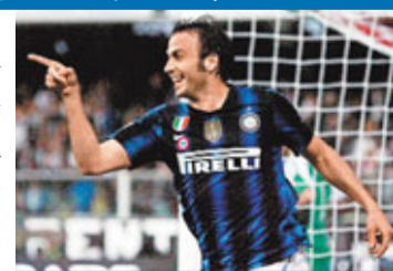
■國米帕仙尼為球隊建功，保住奪冠希望。

國際米蘭(國米)和拿玻里在4月30日意甲倒數第四輪的比賽中，都憑藉最後時刻的入球戰勝對手，避免冠軍爭奪戰提前失去懸念。