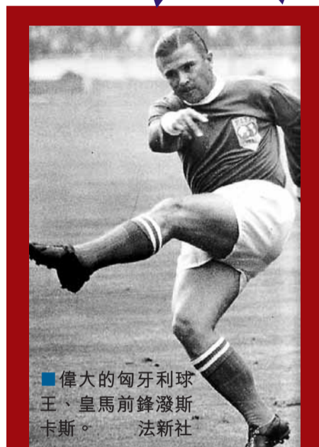
■偉大的匈牙利球王、皇馬前鋒潑斯卡斯。

2010年歐洲金球獎得主美斯，《每日電訊報》認為，他可能也該入圍世界足壇史上最偉大11人。