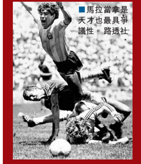
■馬拉當拿是天才也最具爭議性。