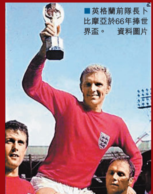
■英格蘭前隊長卜比摩亞於66年捧世界盃。