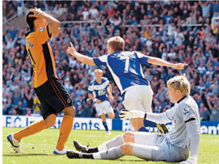
■伯明翰的拿斯臣射破狼隊大門。