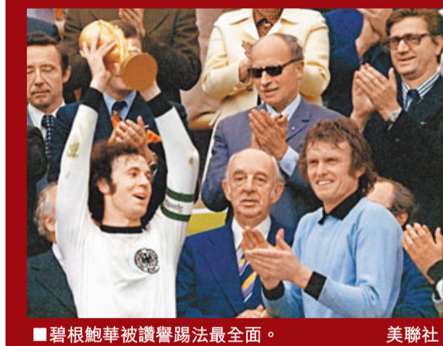
■碧根鮑華被讚譽踢法最全面。

據英國《每日電訊報》日前評選出了世界足壇有史以來最強11人陣容，這套陣容中沒有朗拿度，也沒有一人是現役球員。最接近的是巴塞球星美斯，進入了後備名單。