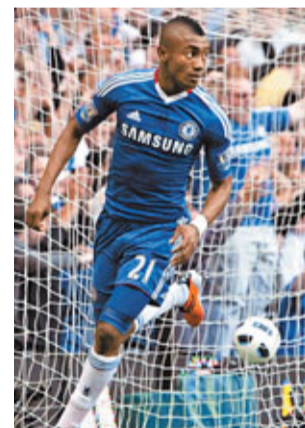
■沙洛文卡勞(左)為車路士射入奠勝球，保住奪冠機會。

英超聯賽30日再戰6場，「藍軍」車路士憑藉第89分鐘的入球以2:1逆轉戰勝勁敵熱刺，延續了爭奪本賽季英超聯賽冠軍的希望。取勝之後，車路士與英超領先的曼聯的差距已經縮小到3分。曼聯昨日作客對陣阿仙奴負0:1。在下周末本賽季倒數第三輪的比賽中，車路士將前往曼徹斯特挑戰曼聯，這場結果也將對英超冠軍的歸屬產生重要影響。