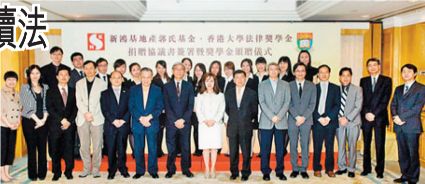
■獲香港大學法律獎學金的學生和新地郭氏基金代表合照。

是次獲獎同學大多來自內地最具名氣的政法及外交大學，對內地的法律體制有一定的認識，並具有較高的理論水