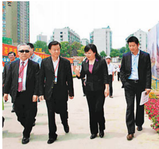
■許榮茂在長沙市委副書記、常務副市長、大河西先導區管委會主任謝建輝的陪同下考察長沙濱江新城項目。香港文匯報記者易新攝