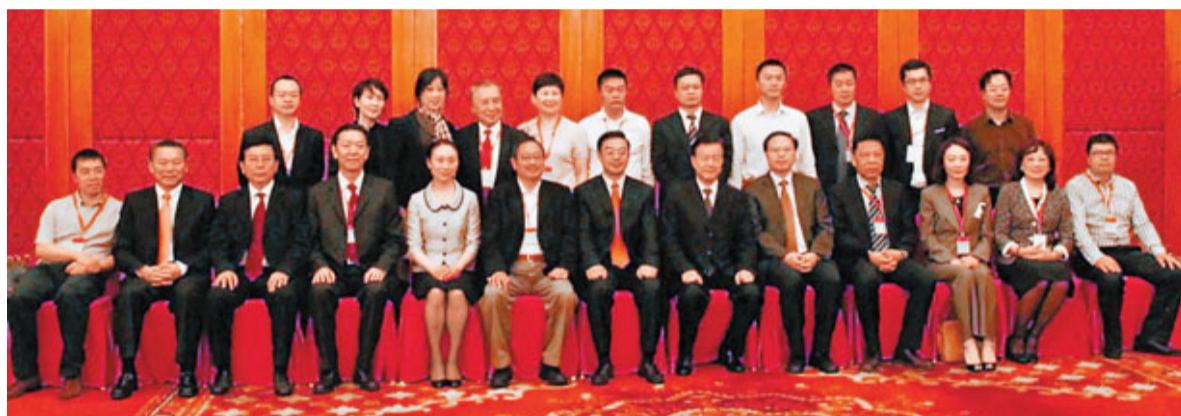
■湖南省委書記周強(前排左七)，省委常委、省委統戰部部長李微微(前排左五)與華商聯訪湘團全體成員合影。香港文匯報記者易新攝

後赴長沙大河西先導區、湘潭九華台灣工業園等地進行了實地考察。 華商聯以「凝聚全球華商精英，促進民族偉大復興」為宗旨，以迅速發展的中國民營經濟產業大軍作後盾和支持力量，是唯一與浙江、「中國民企峰會」結成