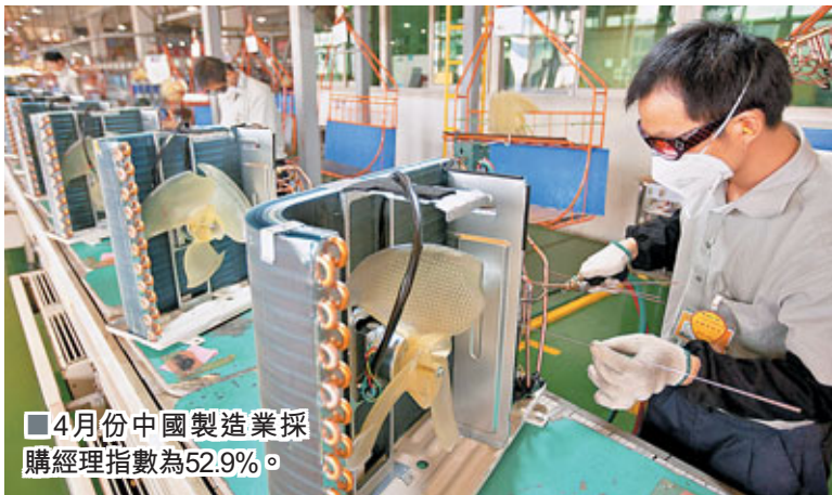
4月份中國製造業採購經理指數為52.9%。

香港文匯報訊(記者 劉曉靜 北京報導)中國物流與採購聯合會(CFLP)昨日(1日)發佈數據顯示,4月份中國製造業採購經理指數(PMI)為52.9%(詳見走勢圖),環比回落0.5個百分點。PMI指數經過3月短暫回升後,再次延續回落勢頭,顯示出經濟增長處於適度回調過程之中,向宏