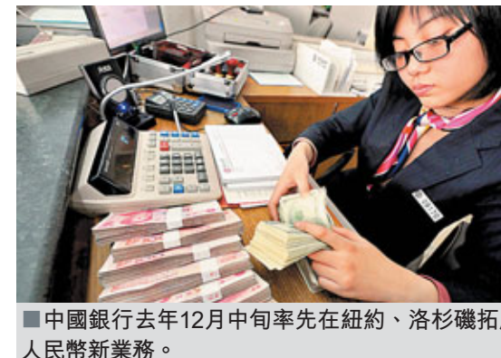
中國銀行去年12月中旬率先在紐約、洛杉磯拓展人民幣新業務。

額,分別為500美元及1,000美元,暫不設個人支票賬戶。兌換額方面,紐約分行開設戶口的個人戶,每日兌換上限為4,000美元,每年上限為2萬美元;未有戶口的客戶,每日上限為2,000美元,每年上限為1萬美元。