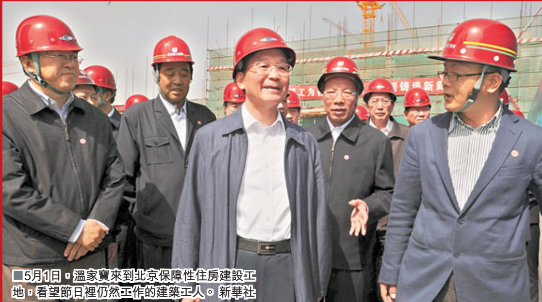
5月1日,溫家寶來到北京保障性住房建設工地,看望節日裡仍然工作的建築工人。

宅建設中佔一定比例,全國的目標是20%,北京提出要超過20%甚至達到30%。至於所謂配套,就是戶型要多樣多,戶型雖小但功能齊全;注意設施配套,有學校、幼兒園、醫院或診所,靠近地鐵或公共交通線路,使大家感到方便。另外,所謂質量,就是從設計、施工、監理到驗收都要堅持「質量第一」的理念;所有建築都要重