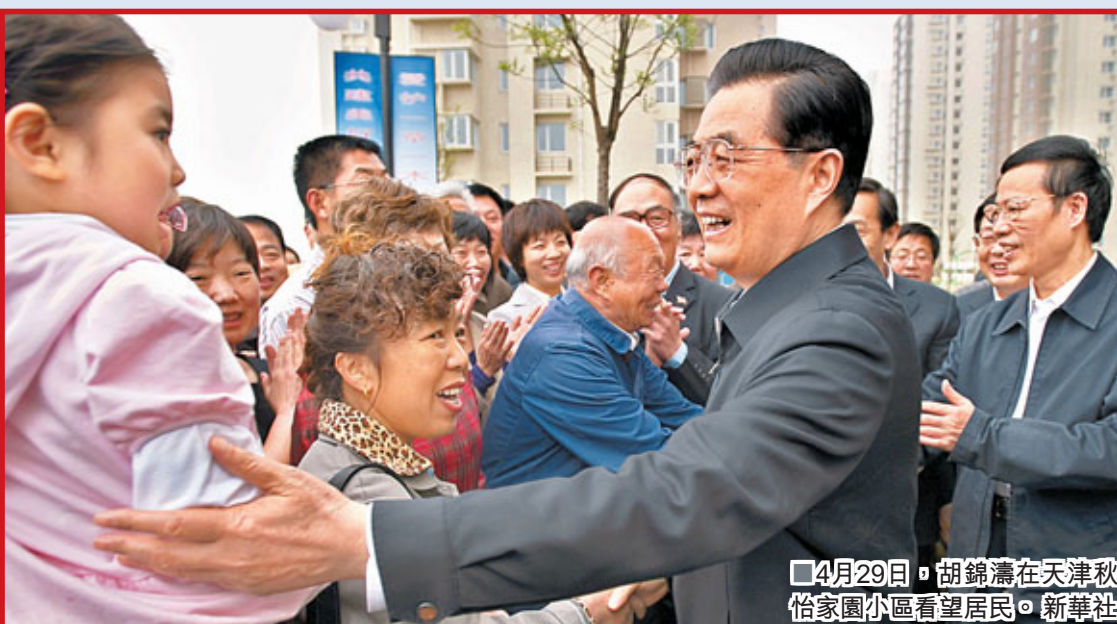
4月29日,胡錦濤在天津秋怡家園小區看望居民。

溫總看望京建築工人 溫家寶十分關心北京的保障性住房建設,於昨日上午前往北京朝陽區王四營保障性住房項目建設工地,看望節日內仍堅守崗位的建築工人。王四營保障性住房項目是北京地區在建規模最大的保障性住房項目,建築規模達64萬平方米,有限價房、公租房、廉租房等各類保障性住房7,160套。溫家寶強調,保障性住房建設要講規模,講質量,講配套,所謂規模,就是說保障性住房要在住