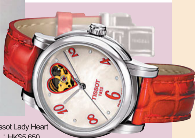
■Tissot Lady Heart 售價：HK$5,650

媽媽如何與囡囡襯到絕？兩人一起穿着同款裝束就最有意思，最近「b+ab迪士尼飛躍系列」特別推出了一款童裝上衣與同款的女裝，讓媽媽可以和囡囡齊齊換上絕襯的「b+ab迪士尼飛躍系列」服裝。另外，「b+ab迪士尼飛躍系列」種類多元化，包括14款於全線b+ab有售的服飾；更有4款限定版服飾只在香港迪士尼樂園全新的「廣場時尚店」獨家發售。