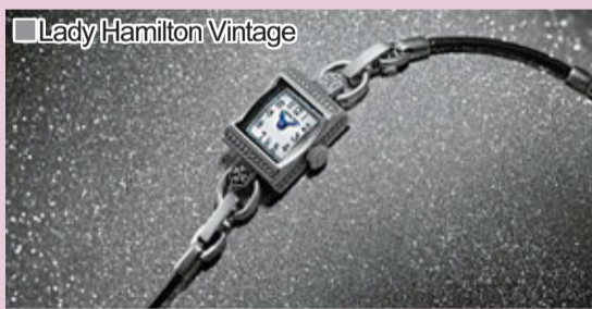
■Lady Hamilton Vintage

另外，時尚的Lady Hamilton Vintage系列推出兩款凸顯綽約美感的新型號，分別採用方形及橢圓形設計，重溫女裝腕錶最初面世的時代。當時女士沒有西服背心口袋放置懷錶，品牌遂特意設計女性專用的時計。腕錶的小巧尺寸，最適合端莊的女性，復古造型也兼備現代特色，方形錶殼別有一番舊日情懷，橢圓型號則以光面幾何圖案作為特色。兩款型號均有獨特的真空離子鍍銀飾面，令現代高級質料更添古韻。