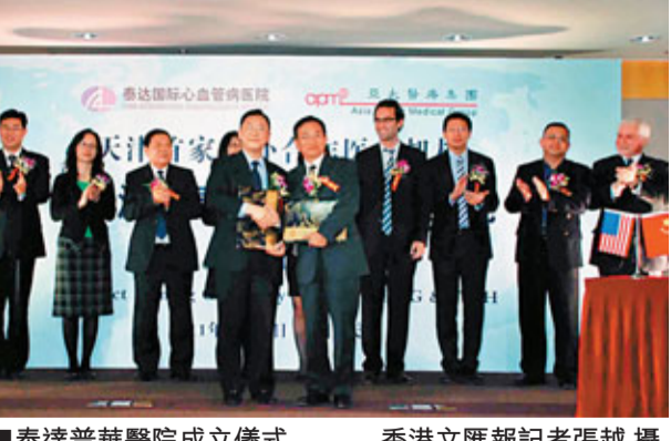
泰達普華醫院成立儀式。

香港文匯報訊(記者 張越 天津報導)4月27日，天津首家中外合作醫療機構——泰達普華醫院在天津經濟技術開發區成立。