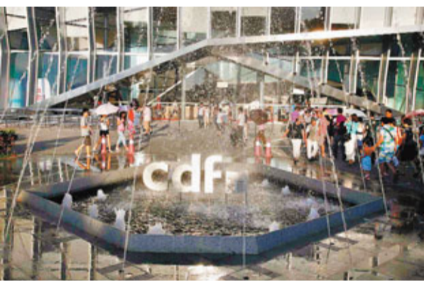
三亞免稅店門前目前已沒有了擁擠人流。

記者從中免集團方面相關負責人處獲悉，為保障貨源充足，三亞市內免稅店從供應商原產地直接進行採購，