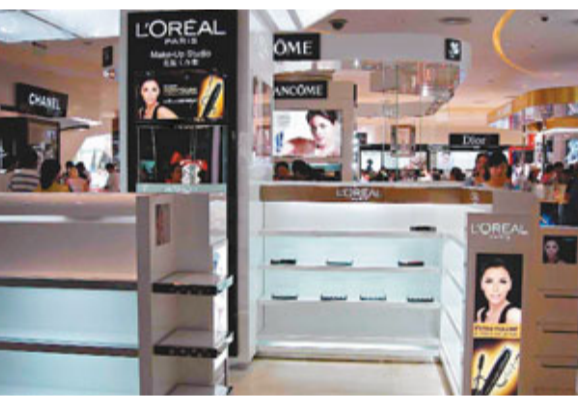
免稅店內某品牌化妝品已斷市。

該負責人表示，從政策試行情況看，暢銷的大多是雅詩蘭黛等5,000元以下的商品，所以免稅店的商品採購結構也根據情況調整，目前三亞市免稅店備貨已經超過3億元，並運調了大批5,000元以下以香水、化妝品、手錶為主的商品。記者在免稅店內發現，購物環境得到明顯改善。香奈兒專櫃服務員告訴記者，與前10來天相比，限