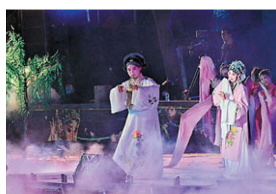
「中國第一水鄉」周莊多年來都是昆山旅遊業的龍頭和「名牌」。