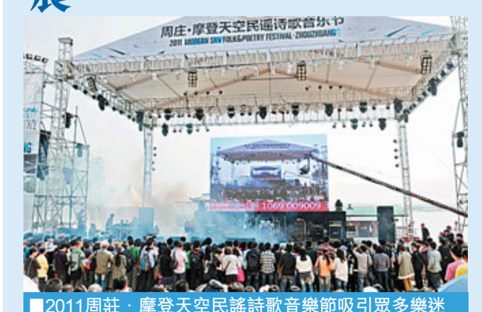
2011周莊·摩登天空民謠詩歌音樂節吸引眾多樂迷。

2011年，昆山全市旅遊業發展的目標為接待遊客總量增長15%，全社會旅遊收入增長18%，完成旅遊項目投資15億元。