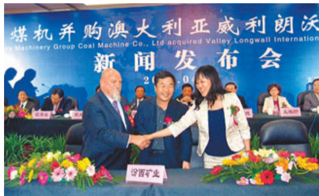
太重煤機分別與山西汾西礦業、華晉焦煤等煤焦企業簽訂設備採購合約，涉資達2億元人民幣。

有業內人士指出，惠南「價格窪地」身份恐難持久，自南匯區併入浦東新區組成了「大浦東」以來，惠南板塊就憑借處於陸家嘴與臨港新城之間的黃金走廊的區位，成為「兩個中心」、「7+1」規劃聯動發展的關鍵流轉樞紐之一，未來區域樓市將在本地居民消費的基礎上，加上迪士尼效應的落地、產業人口導入已全面提升區域置業能級，迎來強大的產業人口自住需求和投資性需求，實際上惠南千畝別墅板塊已進入規劃「紅利」的兌現期。