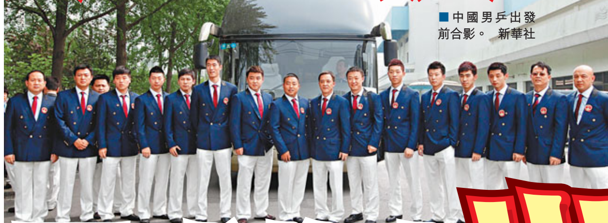
中國男乒出發前合影。