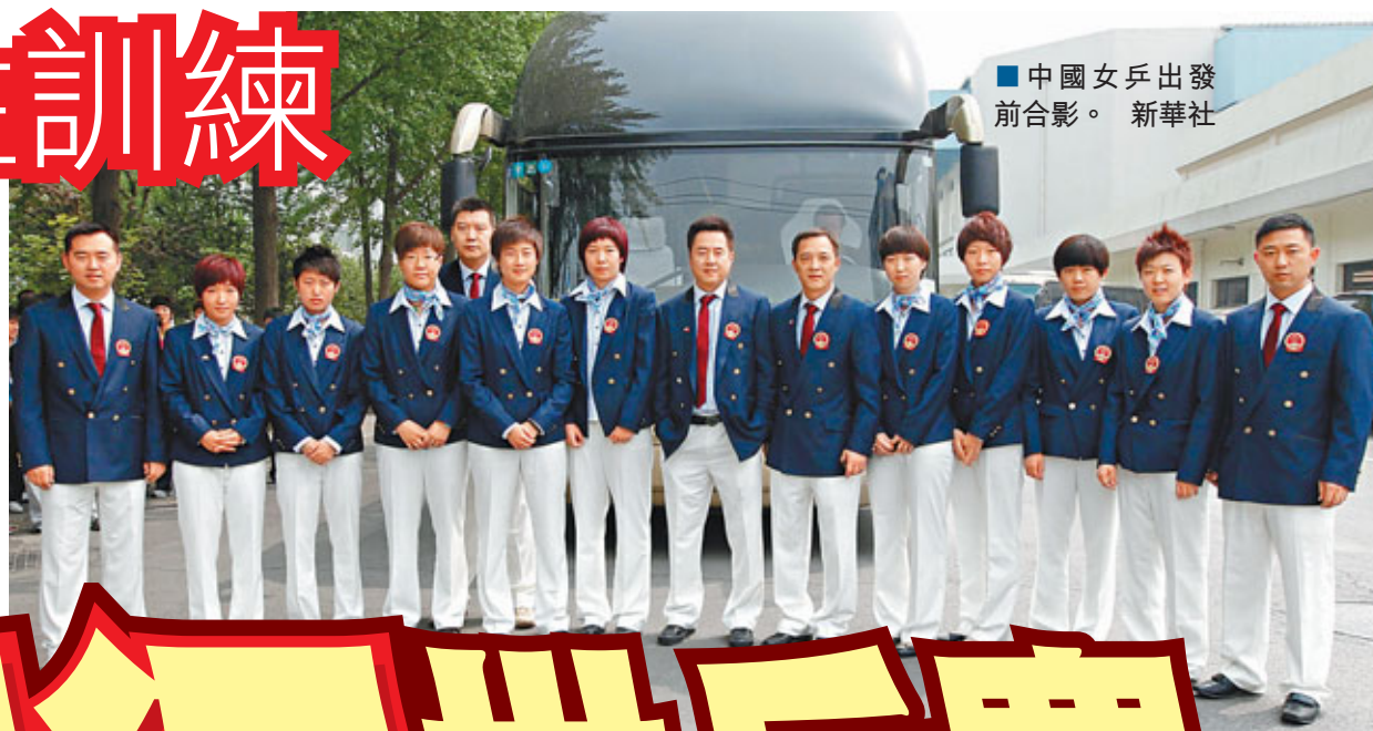
中國女乒出發前合影。