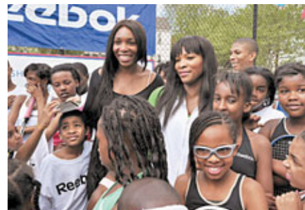
大威(左)與細威周四出席青少年網球教室。