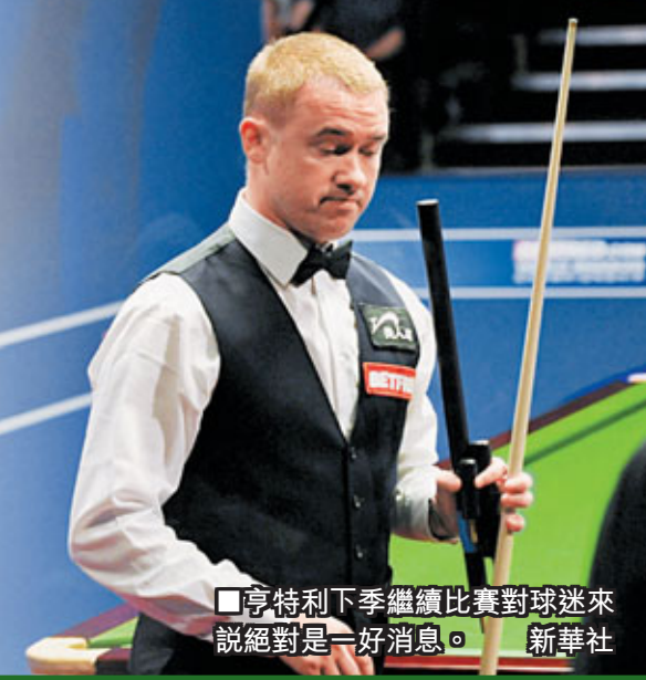
亨特利下季繼續比賽對球迷來說絕對是一好消息。

另外，在4強首節以總局數3:5落後的丁俊暉，昨日出戰第2節賽事，前4局與英格蘭新貴卓林普各贏2局，後4局則全勝，經過2節比賽後，丁俊暉暫以總局數9:7反先卓林普，二人將於今日進行4強賽最後一節，爭奪決賽入場券。(now637台今日9:30p.m.直播) ■蔡明亮