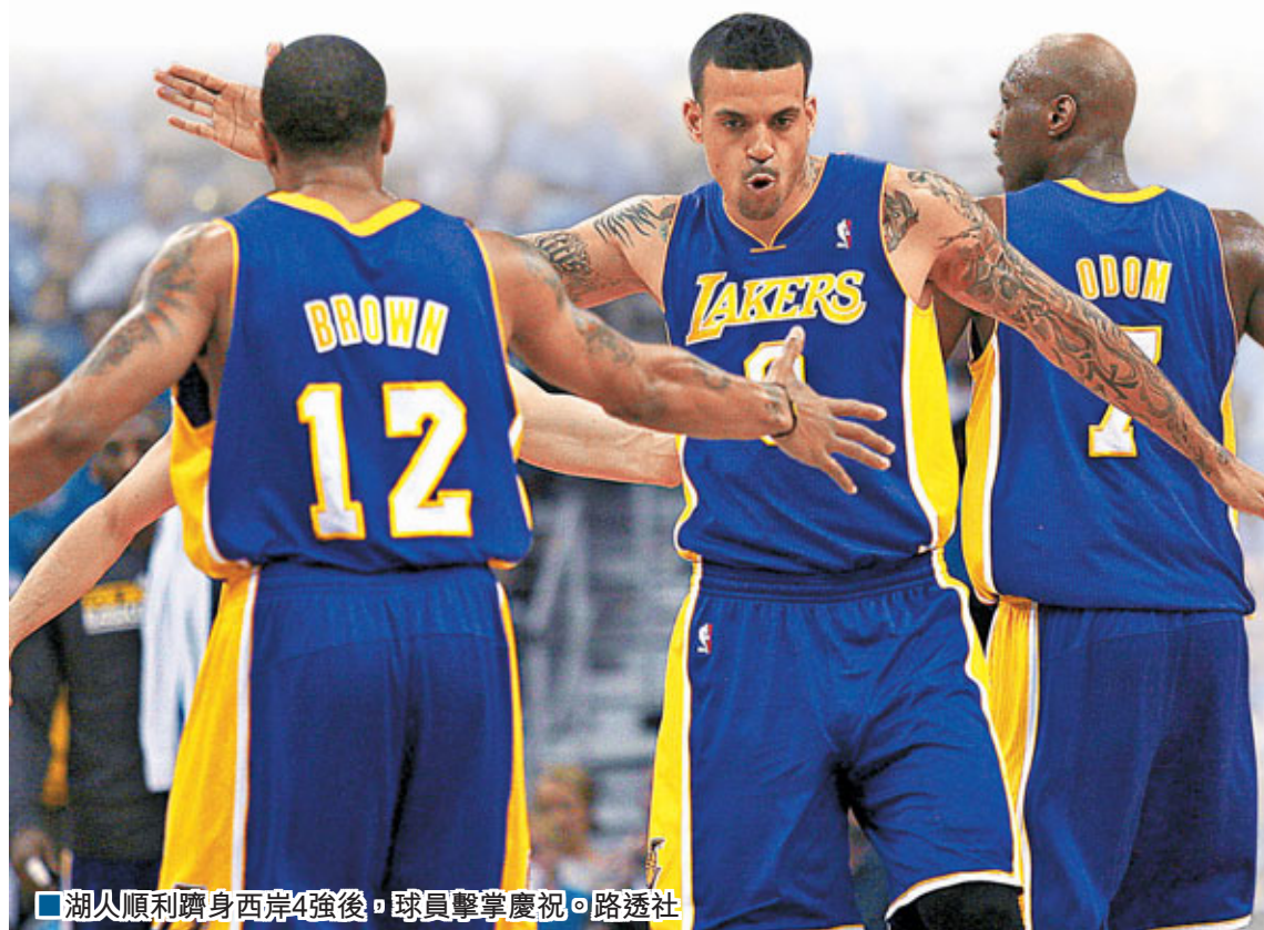
湖人順利躋身西岸4強後，球員擊掌慶祝。