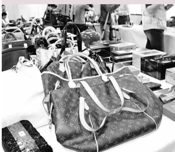
偵破精品大盜 台中市警方29日偵破一起獨棟別墅及豪宅竊案，從涉嫌人家中起出500多項各式精品贓物，包括名錶、鑽戒、名牌包、洋酒等各項名品，宛如小型精品店。 中央社

另外，這次也公布健康小食，包括米苔目湯、蔬菜類滷味、花生仁豆花、潤餅等。吳映蓉說，危險小食並非完全不能吃，而是要聰明吃，例如到了夜市先挑選低熱量小食，像是燙煮的滷味，有菜有肉的潤餅等，最後再吃高熱量食物。