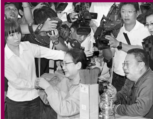
兩名家屬在祭拜時泣不成聲。