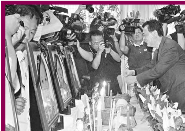
罹難陸客家屬29日前往嘉義市立殯儀館靈堂祭拜。

在旅行社安排下，家屬將先留在嘉義辦理認屍手續，並協調火化、骨灰運送及後續賠償問題。此外，陪同遊客家屬來台的青島市旅遊局副局長萬飛表示，首批來台的共有18位死傷者親屬，傷者親屬於29日上午趕到嘉義地區的6家醫院看望自己的親人。目前，遇難者遺體是否火化後帶回大陸，還要尊重家屬意願。青島市旅遊局將與海旅會台北辦事處、嘉義有關方面保持密切聯繫，全力協助家屬做好善後工作。