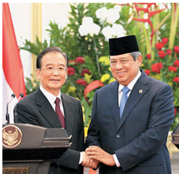
29日,中國國務院總理溫家寶與印尼總統蘇西洛舉行會談。

據中新社雅加達29日電 中國總理溫家寶29日在雅加達與印尼總統蘇西洛舉行會談,雙方同意制訂領導人定期會晤機制。兩人就雙邊關係及共同關心的國際和地區問題坦誠、深入交換意見,達成重要共識。