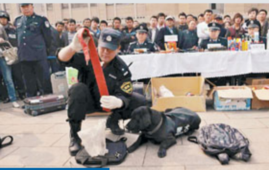
警犬「查炮」 29日,北京鐵路警方在北京火車站前廣場舉辦「大走訪」警營開放日活動,向廣大旅客進行面對面的「三品」安全宣傳,介紹進站安檢注意事項。據悉,截止到4月20日,鐵路警方已查獲各類違禁物品近6萬件。圖為搜爆犬發現現場一黑色電腦包內有鞭炮。

華為稱,其在德國、法國和匈牙利對中興通訊提起法律訴訟,指控其侵犯了華為的專利權和商標權。起訴內容包括中興侵犯了華為有關數據卡和LTE技術的一系列專利,並且未經華為許可,在數據卡產品上非法使用了華為的註冊商標。華為首席法律官宋柳平稱,為了保護其創新成果以及在歐洲合法註冊的知識產權,華為不得不採取此次法律行動。華為的目標是終止中興通訊對華為知識產權的非法使用,並通過協商解決糾紛,使華為的技術能夠以合法的方式得到使用。中興通訊有關人士稱,對華為在歐洲對該公司提起法律訴訟表示震驚,並稱中興通訊一向尊重知識產權,包括自己的知識產權和他人的知識產權,並表示將運用法律手段維護自身的利益。