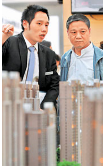
內地樓價近年節節上升。圖為市民在了解房地產信息。

文章將樓價上漲歸咎於居民收入增加,遭到了網友的大力反駁。有網友反諷道,根據此學者的邏輯,大幅降低民眾工資便是降低房價的最好最直接的方法。也有網友指出,居民收入大幅增加的同時是通貨膨脹不斷上升,居民的實際購買力下降。投資能力越來越強,也不是一個普遍現象,尤其是房地產投資,更是有錢人的投資標的。作者這是有意將一小部分的「有錢居民」代替普遍的公共大眾,這篇文章有為既得利益群體辯護之嫌。