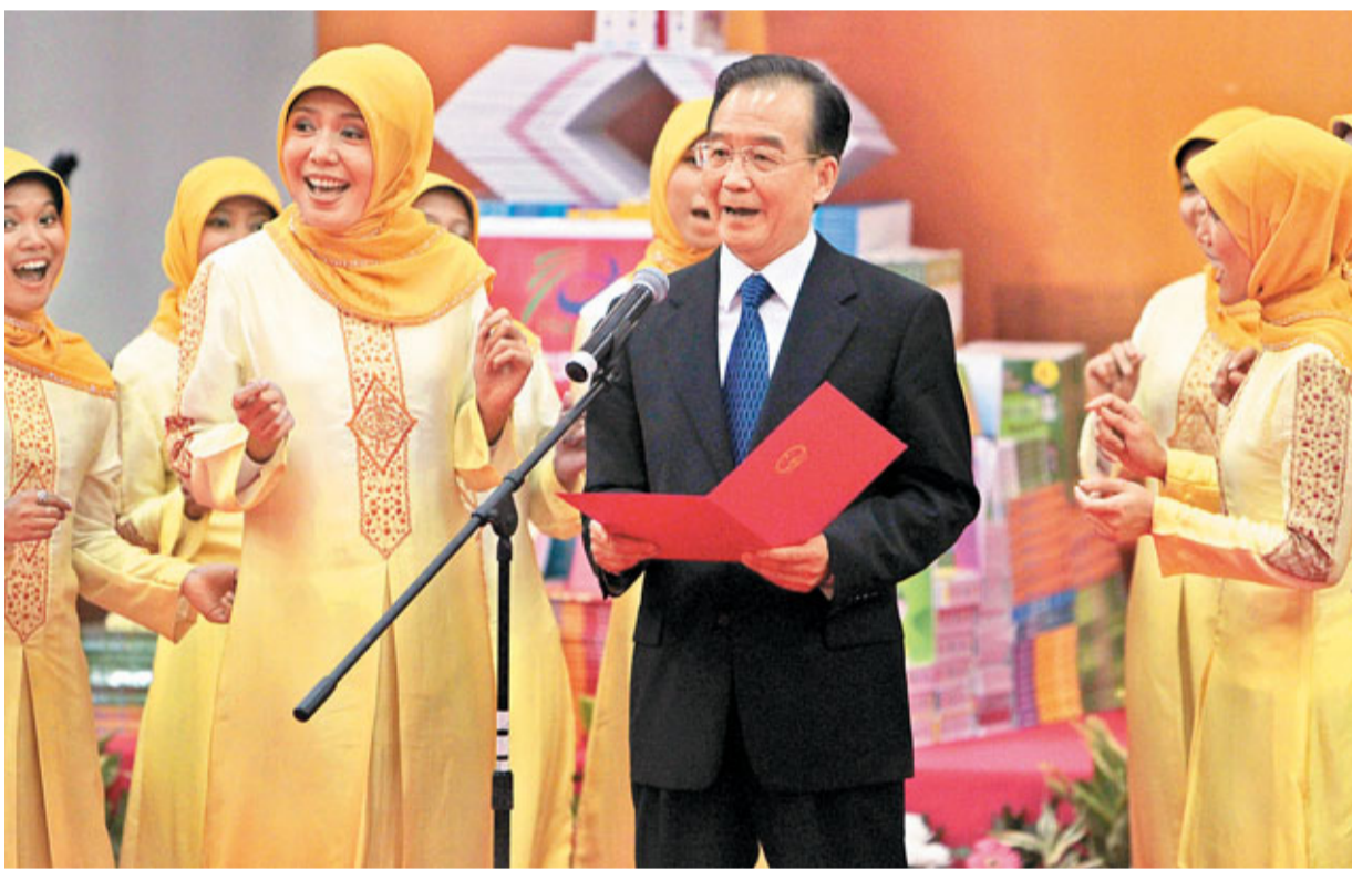
29日,中國國務院總理溫家寶在印尼首都雅加達參觀阿拉扎大學,並與該校師生親切交流。圖為溫家寶與學生們一起演唱印尼民歌《哎喲媽媽》。

會談後,兩國領導人出席了雙邊合作文件的簽字儀式,並共同會見了記者。會談前,蘇西洛為溫家寶舉行了隆重的歡迎儀式。