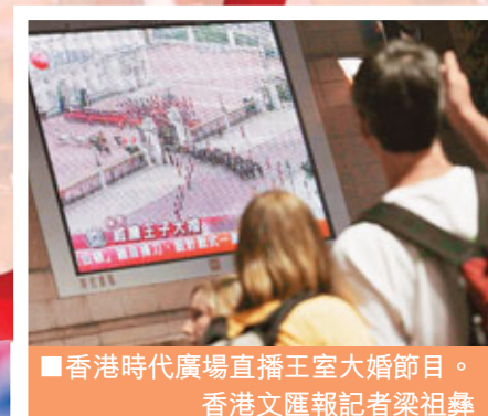
香港時代廣場直播王室大婚節目。