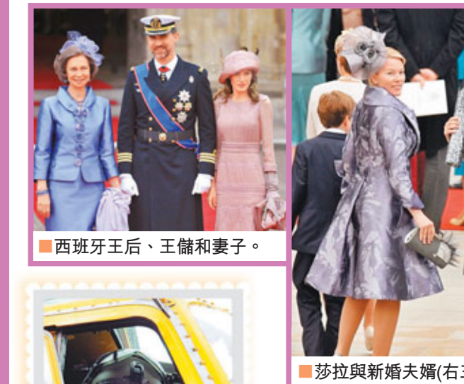
西班牙王后、王儲和妻子。

美國民眾當然亦不錯過盛事,婚禮在美國東岸時間凌晨4時開始,不少人天色未亮便起床觀看直播,餐廳和酒吧掛滿英國國旗,連雞尾酒名稱也別具王室特色。在印第安納波利斯,市民巴尼特把客廳裝飾得活像婚禮教堂,兩旁排滿椅子,賓客得穿上印有威廉和凱特肖像的衣服。 位於南半球的澳洲和新西蘭亦不遑多讓,民眾昨日與高爾烈慶祝王室婚禮,《澳洲人報》稱「灰姑娘童話進荷里活都」垂涎三尺」。有同性戀者在悉尼舉行同性王室婚禮派對,寓意同性戀者亦能尋得真愛。