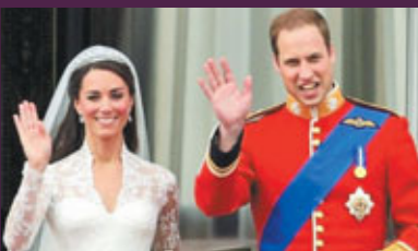
王子伉儷 Say Hi