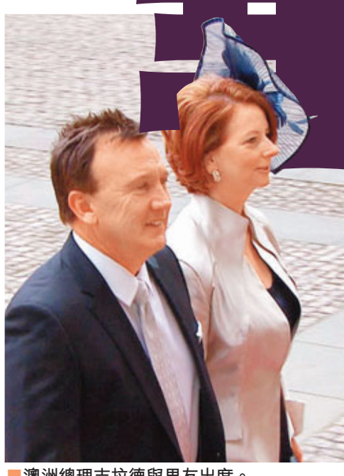
澳洲總理吉拉德與男友出席。