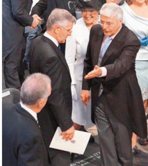
保守黨前首相馬卓安(右)。