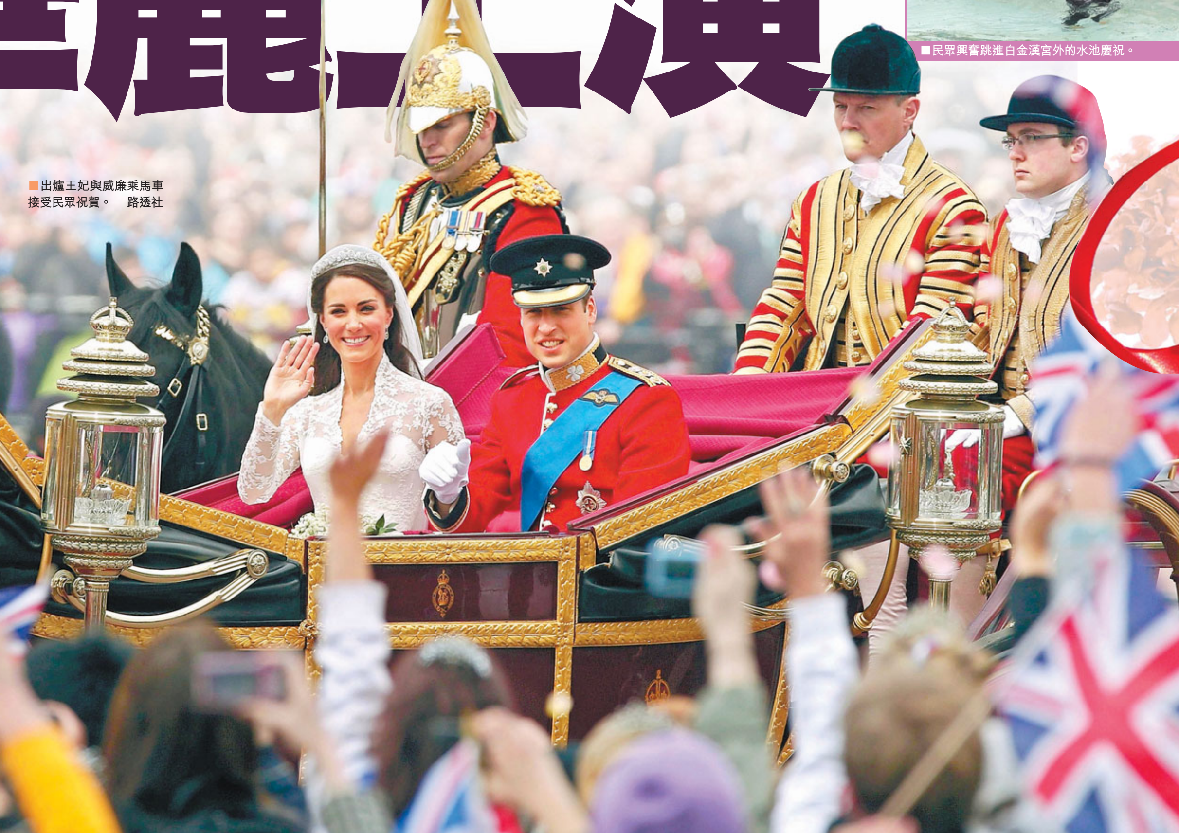
出爐王妃與威廉乘馬車接受民眾祝賀。