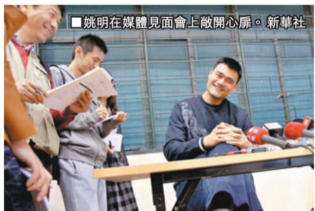
■姚明在媒體見面會上敞開心扉。

香港文匯報訊(記者 張一波、章蘿蘭 上海報導)今年年初，中國國家形象宣傳片「人物篇」首次在美國紐約時報廣場大型電子顯示屏上滾動播出。就在27日，三位國家形象宣傳片中的人物楊利偉、姚明、范冰冰齊聚上海，就「我們共同的國家形象」展開討論。會上，剛回國不久的姚明自然成為了媒體的焦點，而談論的話題大多離不開女兒姚沁蕾。