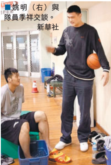
■姚明(右)與隊員季祥交談。

至於姚明的另一項大投資——上海男籃，「姚老闆」的虧損亦是不小。此前有傳言稱，上海男籃虧損2000萬元，甚至是驚人的5000萬。不過，「姚老闆」對此倒是心態從容，「我們也有這樣的思想準備，在前幾年的時候確實投入和產出有很大的出入，但過幾年會好些。」