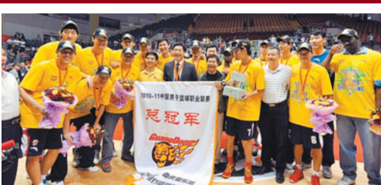
■廣東隊第七度獲得CBA總冠軍。