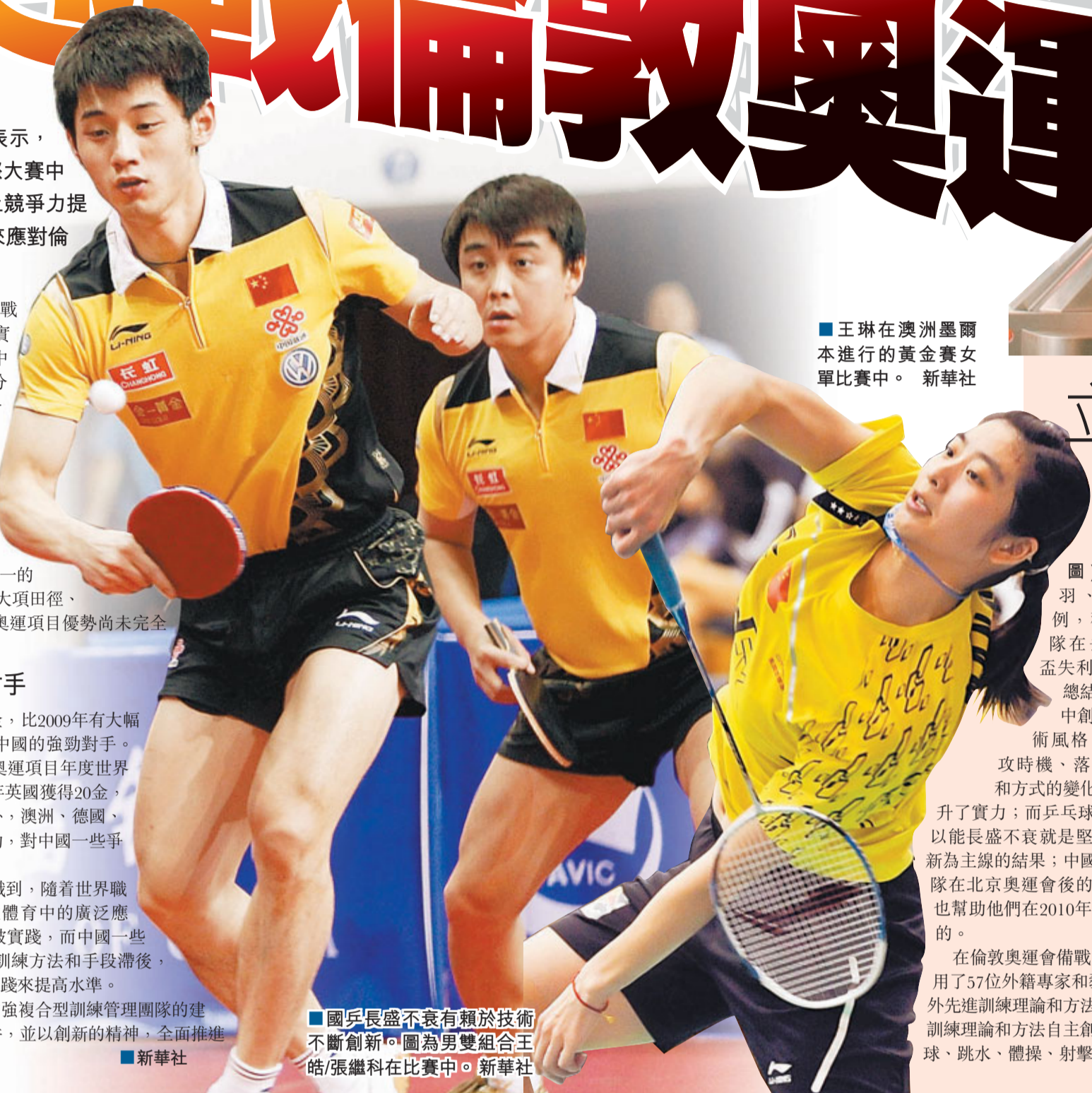
■王琳在澳洲墨爾本進行的黃金賽女單比賽中。