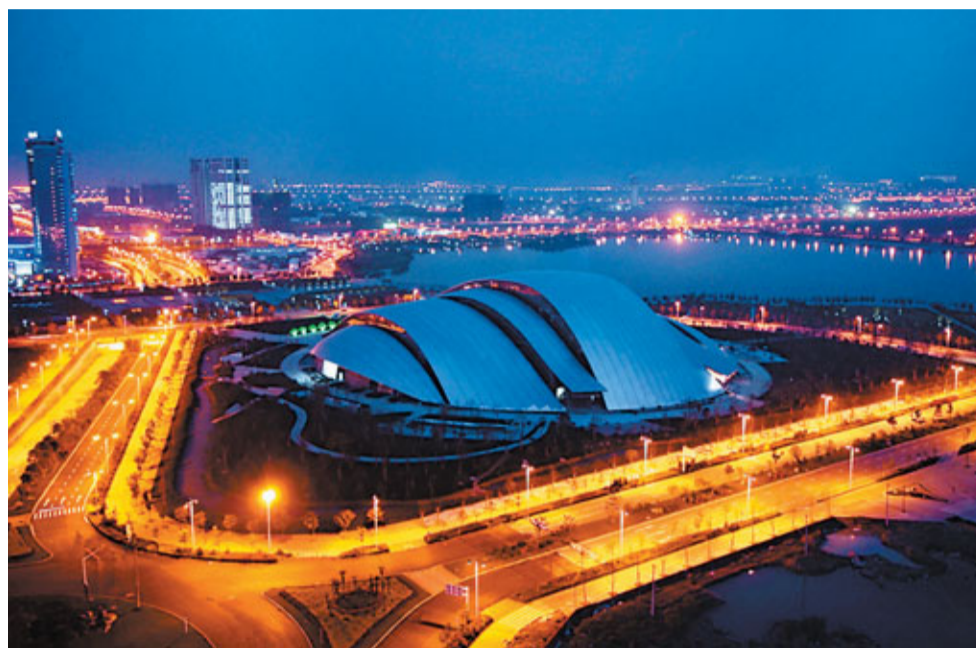
合肥大劇院通過「免費開放日」等形式實現文化惠民。

面向「十二五」,合肥將努力推進文化強市建設,立足建設現代化濱湖大城市和全國有影響的區域性特大城市的實際需要,圍繞合肥經濟圈、皖江城市帶承接產業轉移示範區的建設,深化並擴大改革,不斷解放和發展文化生產力。合肥將推動出版印刷發行、廣播影視、工藝品製造、文化旅遊、創意設計、數字動漫、廣告會展、娛樂休閒等八大重點產業發展,努力形成產業優勢。同時,培育特色文化產業板塊,推動文化與科技融合,培育一批綜合實力強、發展後勁足、競爭優勢明顯的文化企業,以骨幹企業帶動產業升級。合肥將鼓勵和支持骨幹文化企業兼併重組,重點培育5、10家實力雄厚、具有輻射帶動力的文化企業,並培育2-3家文化產業上市公司。到「十二五」末,累計實施項目突破500個,投資金額達到3,000億元,把合肥建設成區域性文化產業發展中心。文化產業增加值將達到500億-600億元,佔全市地區生產總值的8%-10%,成為全市最重要的支柱產業之一。