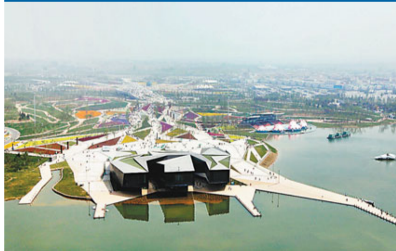
西安世園會創意館鳥瞰圖。

香港文匯報訊(記者 馬靜、李陽波、胡秦玉、李媛 西安報導)2011年西安世界園藝博覽會28日正式拉開帷幕,開園迎客。記者在園區看到,別具特色的香港園成為西安世園一大亮點,香港園主要標誌物——風臨樹成為整個世園會綠色環保的經典之作。