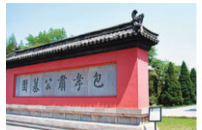
包河區打出「包公」牌,建設文「安」徽省合肥市包河區圍繞打好「濱湖」牌——建成

化名區。圖為包公墓園。東」、打好「汽車」牌——建成「江淮車谷」、打好「包公」牌——建成「文化名區」的三大戰略目標,培育文化產業成為經濟發展的重要增長極,以建設文化名區。2010年,包河區文化產業增加值達29.2億元,佔該區GDP比重為8%左右。