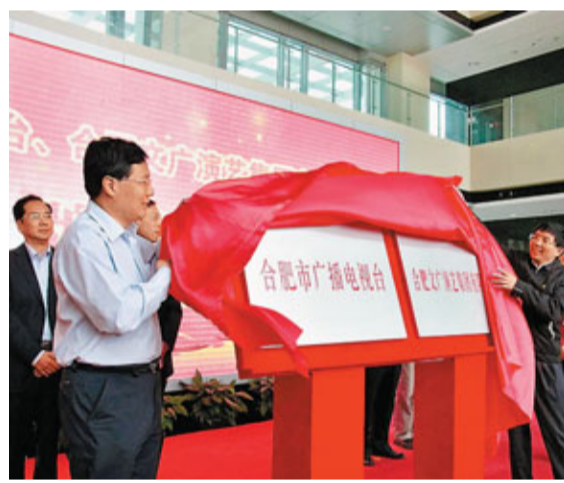
合肥推進文化體制改革,文廣演藝集團、合肥廣播電視台於27日成立。

香港文匯報訊(記者 張長城 合肥報導)合肥政務文化新區是合肥市面向新世紀推動城市建設的代表作,也是合肥推動文化產業發展、文化設施惠民的代表。在發展規劃上,合肥政務文化新區即堅持「創新引領、文化提升」的基本戰略。今天,政務文化新區已成為合肥市文化項目聚集度最高、文化設施品質最優、文化惠民措施最實的現代新城區。