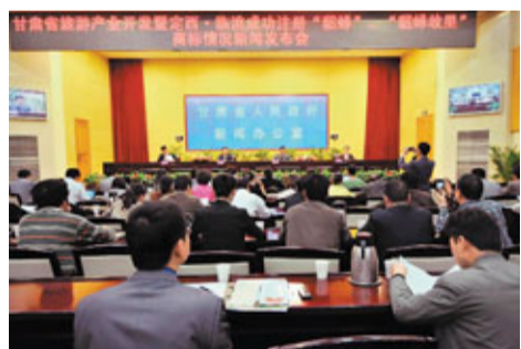
「貂蟬故里」發佈會現場。

香港文匯報訊(記者 王岳 蘭州報導)甘肅省政府新聞辦28日消息,臨洮縣政府通過商標註冊的方式向國家工商總局商標局提出了正式申請,目前已經註冊成功「貂蟬」41個類別、「貂蟬故里」37個類別,共78個商標類別,甘肅、山西、陝西三省四地的「貂蟬故里」之爭至此告一段落。