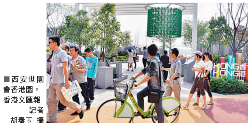
西安世園會香港園。

世界園藝博覽會被譽為世界園林園藝界的「奧林匹克」盛會。2011年西安世園會於4月28日至10月22日在西安舉辦,會期178天,以「天人長安,創意自然——城市與自然和諧共生」為主題。世園會共設置室外展園109個,有32個國家和地區參加世園會並佈置自己的園區,整個園區總面積418公頃、水域面積188公頃,是歷屆世園會中面積最大、水域最廣的一屆,預計參觀遊客將達到1,200萬人次。