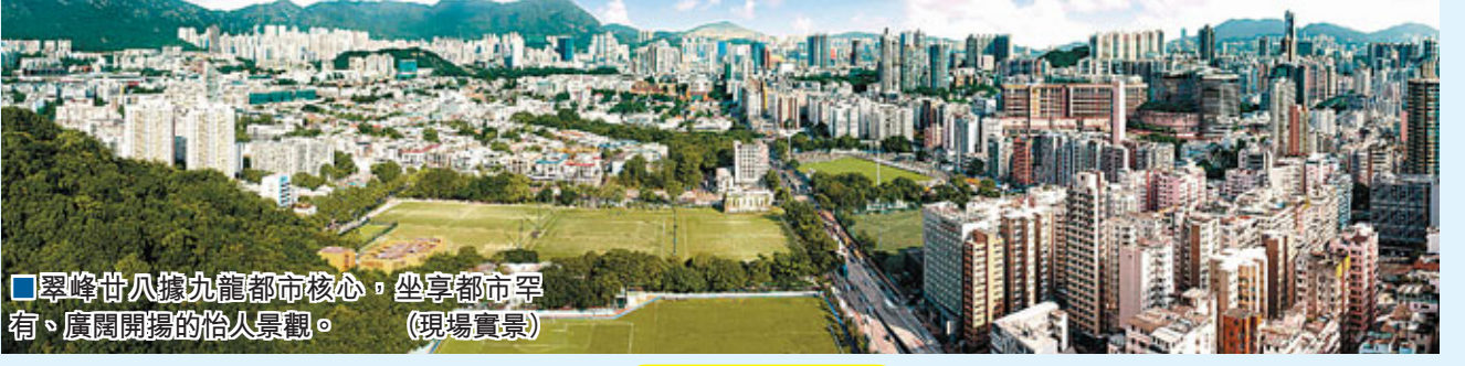
翠峰廿八據九龍都市核心，坐享都市罕有、廣闊開揚的怡人景觀。(現場實景)

由麗新集團精心策劃的全新現樓項目—翠峰廿八，位處九龍都會核心，傲擁九龍塘逾百萬呎翠綠景致與璀璨耀目的都會盛景，毗鄰港鐵太子站，盡享便捷交通之餘，物業設計更承傳一層兩戶的豪宅間隔，配以落地對流窗屏及國際名牌家電配套，精選單位呎價僅7,300餘元起，實在是都會核心罕有難得的優尚之選。