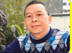
黃先生覺得新居令自己及家人都住得舒服

翠峰廿八現正推售位於高層的精選單位，呎價僅7,300餘元起，以市區核心一手物業而言，售價實屬吸引。同時，發展商更送贈等於樓價3.75%的釐印費及樓價3%之免1年供款利息，讓買家更靈活調配資金，實現置業夢想。此外，翠峰廿八買家不乏中港人士和國內投資者，發展商為配合他們的需要，更推出置業收租計劃，出售連租約單位，當中回報率高達3%。同時，業主亦可選擇發展商提供的一站式代租代管服務，輕鬆地收取穩定回報。