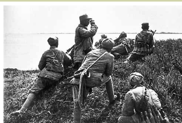
江北的解放軍向江南岸瞭望。