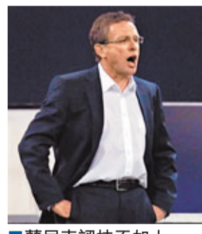
蘭尼克認技不如人。