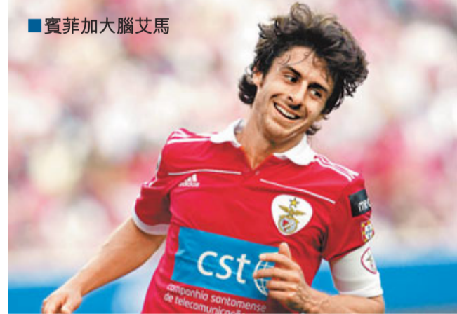
實菲加、布拉加及波圖,這三支闖入歐霸4強的葡超強隊,連同西甲的維拉利爾;充滿葡國風情的歐霸盃4強首回合,明

晨將揭開戰幔。其中,實菲加先於主場對布拉加,展開「葡國內訌」(有線62及202台周五3:05a.m.直播);至於,成為新葡超霸主的波圖,則在主場對抗外敵維拉利爾(有線61、64、201及203台周五3:05a.m.直播)。