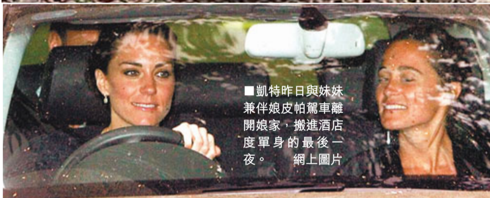
凱特昨日與妹妹兼伴娘皮帕駕車離開娘家，搬進酒店度單身的最後一夜。

數以千萬計英國民眾和全球20億直播觀眾，明天將見證英國威廉王子與準王妃凱特（前譯凱蒂）舉行當地30年來最大型「世紀婚禮」。英國警方為了今次盛事嚴陣以待，而一對準新人在終身大事舉行前，亦不禁大為緊張，據報凱特甚至發了多年未曾作過的噩夢——自己竟然全裸出席婚禮！