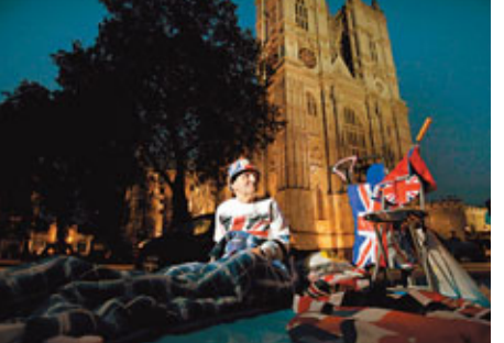
76歲的曠特全身國旗look在西敏寺外紮營過夜。

大婚舉世矚目，威廉的鋒頭更是一時無兩，加上凱特魅力不凡，威廉成為下任國君的呼聲完全蓋過父親王儲查爾斯。儘管查爾斯在繼承順位排首位，未來登基是名正言順，但要服眾則恐怕甚艱難。