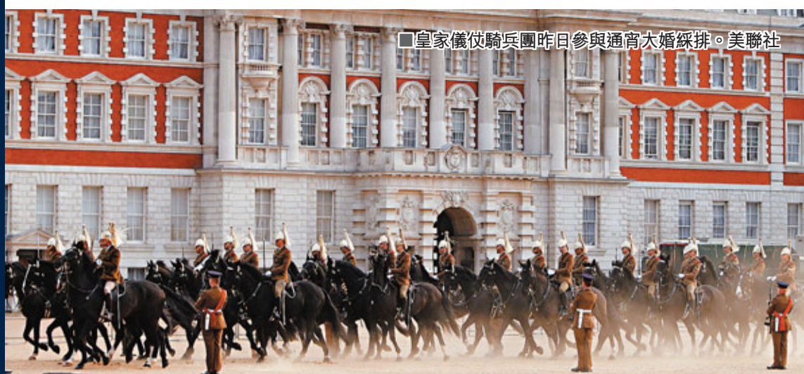
皇家儀仗騎兵團昨日參與通宵大婚綵排。

Ipsos上週民調顯示，46%受訪民眾認為查爾斯應「讓路」予威廉成為新君主。威廉形象親民，不少民眾認為在優雅高貴的凱特襄助下，28歲的威廉能為君主制帶來新氣象。然而，君主制世襲的傳統不會被民意動搖，查爾斯仍是登基第一人選。■《華盛頓郵報》