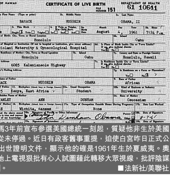
奧巴馬出世紙曝光

由奧巴馬3年前宣布參選美國總統一刻起，質疑他非生於美國的陰謀論從未停過。近日有政客舊事重提，迫使白宮昨日正式公開奧巴馬出世證明文件，顯示他的確是1961年生於夏威夷。奧巴馬罕有地上電視批批有心人士試圖藉此轉移大眾視線，批評陰謀論「愚蠢」。