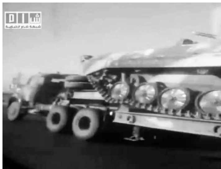
軍方運送坦克和裝甲車至德拉。