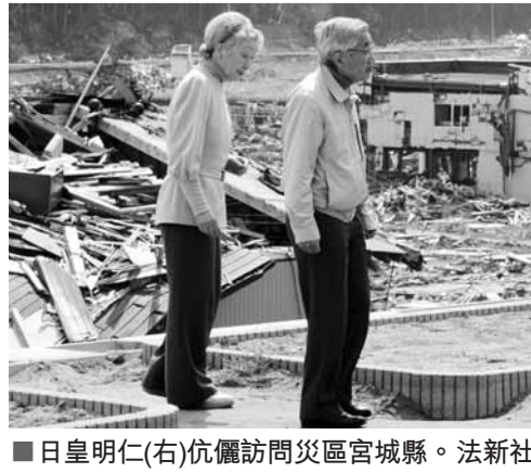
日皇明仁(右)伉儷訪問災區宮城縣。

日本福島第一核電站放射性污水滲漏問題嚴重，政府擬在地底設大型儲罐存放輻射水。千葉縣有大量禁售蔬菜流入市場，大部分更被消費者食用，縣政府譴責行為，並向消費者致歉。東京電力公司昨日稱，上月核電站爆炸時，有女員工接觸輻射3倍以上的輻射量。