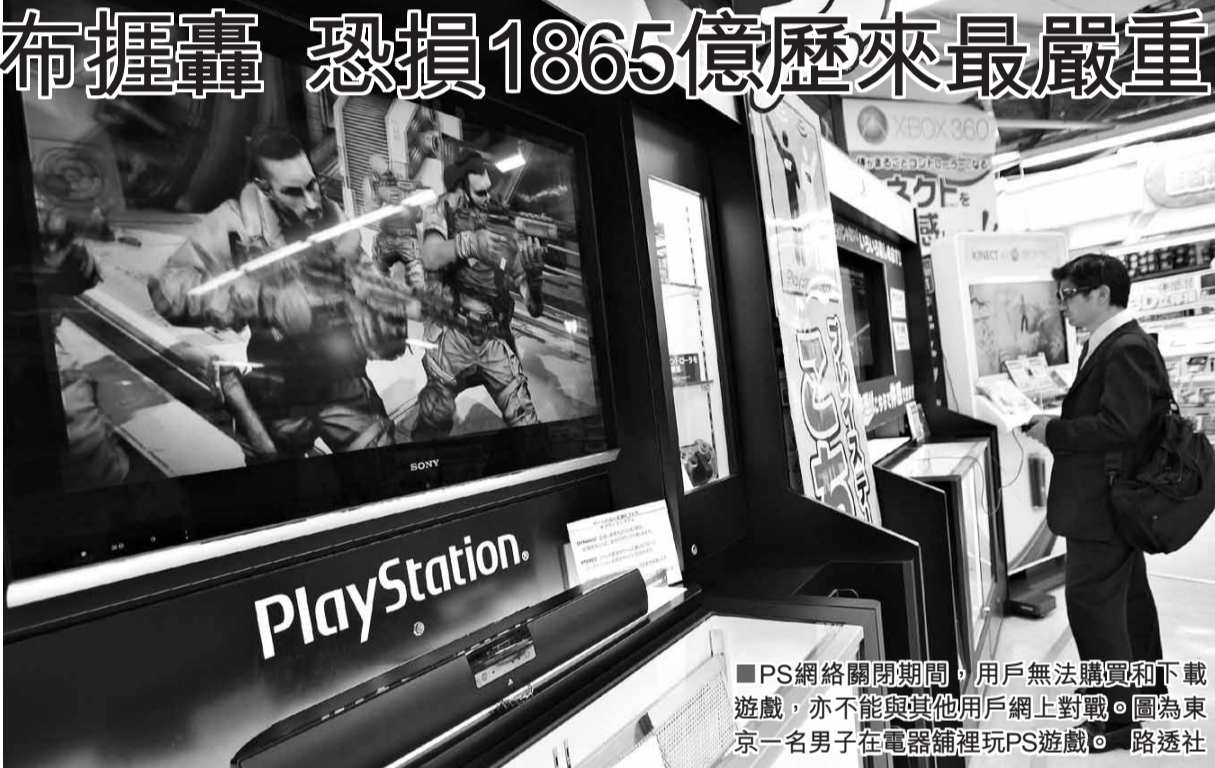
PS網絡關閉期間，用戶無法購買和下載遊戲，亦不能與其他用戶網上對戰。圖為東京一名男子在電腦舖裡玩PS遊戲。

索尼公司(Sony)的PlayStation遊戲網絡本月17日遭黑客入侵，多達7,700萬用戶的資料可能被盜，包括姓名、地址、出生日期和信用卡號碼等。索尼上週三關閉網絡，但直至前日才向外界公布，惹來用戶猛烈抨擊。專家認為，這是歷來最嚴重的黑客盜竊數據事件，可能令索尼蒙受逾240億美元(約1,865億港元)損失。報道指，索尼已經將事件通知專責電腦犯罪的美國聯邦調查局(FBI)聖迭戈支局。