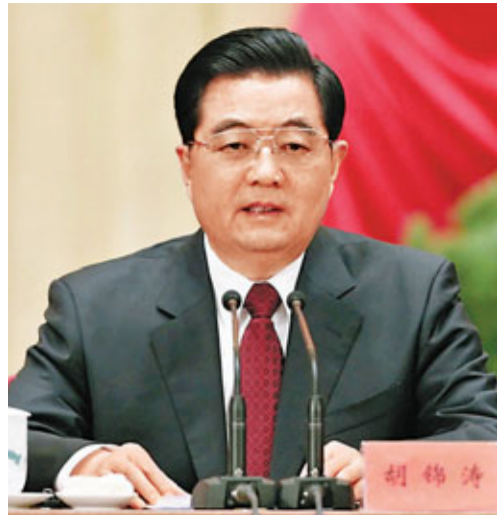
■胡錦濤指出，人口是影響經濟社會發展的關鍵因素。

香港文匯報訊 據新華網27日報道，中共中央政治局4月26日下午就世界人口發展和全面做好新形勢下中國人口工作進行第二十八次集體學習。中共中央總書記胡錦濤在主持學習時強調，要充分認識我國人口問題的長期性、複雜性、艱巨性，不斷增強做好人口工作的自覺性和主動性，加強戰略研究，加強政策統籌，加強工作協調，加強任務落實，不斷開創人口工作新局面，為「十二五」時期經濟社會發展創造更加有利的人口環境。