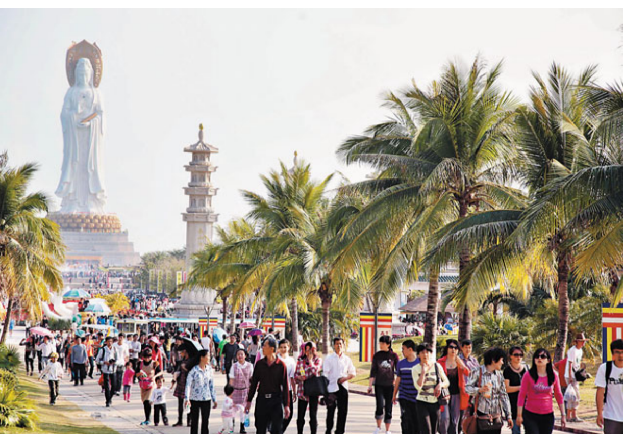
■社科院發表的《旅遊綠皮書》表示，中國旅遊房地產發展勢頭強勁，潛在問題令人擔憂。圖為海南三亞南山文化旅遊區。

綠皮書還介紹說，近幾年來，隨著北京奧運會、上海世博會和廣州亞運會等大型國際活動的舉辦，中國的飯店業出現了新一輪發展熱潮。一些大型國際餐飲巨頭表現出極大熱情。高星級飯店數量增長快，多集中在北京、上海、廣州、重慶和湖南、湖北等省市。經濟型酒