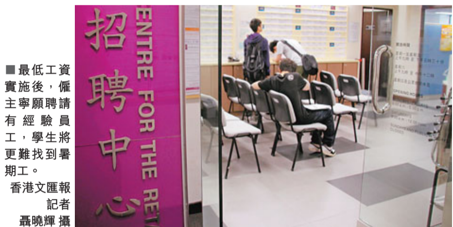
最低工資實施後,僱主寧願聘請有經驗員工,學生將更難找到暑期工。