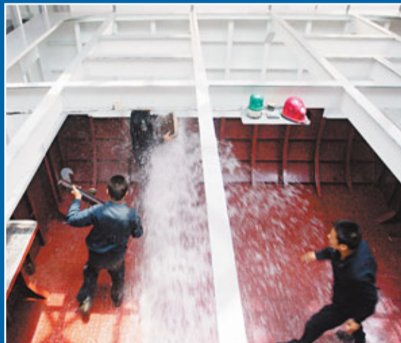
艦艇模擬擱淺訓練。