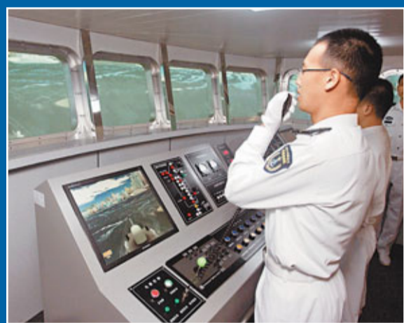
艦艇模擬駕駛艙,預設多種駕駛危機,包括風浪及夜間場景,讓海軍對危機及早作好準備。