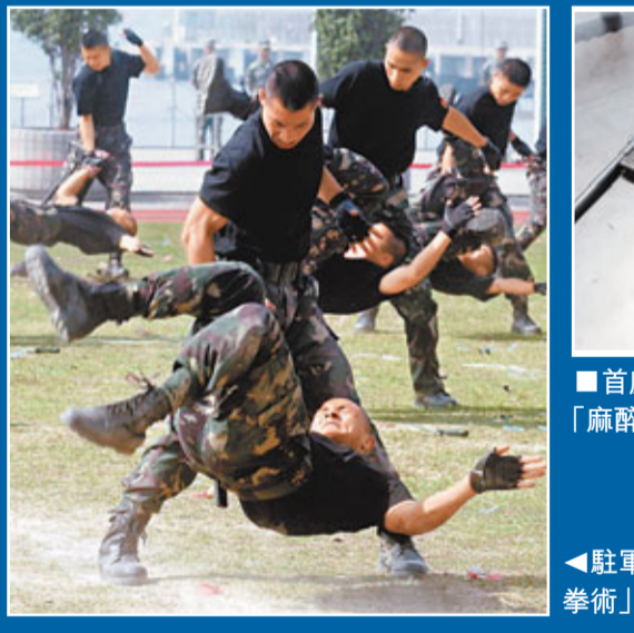
駐軍反恐精英利用軍刀表演「特種兵拳術」。