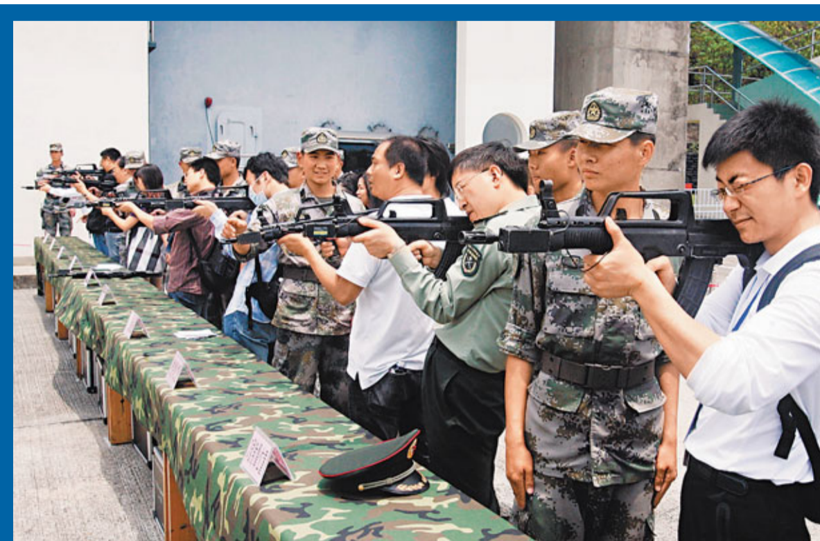
「激光模擬對抗射擊」為新增的實踐體驗環節。每名市民可即場進行歷時5分鐘的「模擬射擊」,期間更有駐軍從旁指導。

今年的「五一軍營開放」,昂船洲、石崗及新圍三個軍營,將分別於周日及周一開放。其中,昂船洲軍營開放時間為星期日(5月1日)上午10時半至下午2時,估計將吸引1.3萬名市民參觀;石崗軍營及新圍軍營,則緊接在周一(5月2日)開放;前者開放時段為早上10時半至下午2時,後者為下午2時半至5時,兩軍營預料有2.2萬人參觀,令歷年參加軍營開放日的市民人數增至42萬。