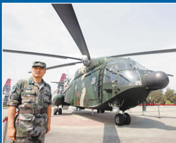
「直9-ZH型直升機」為單旋翼帶涵道尾槳式直升機,產自哈爾濱飛機製造公司,主要用作指揮、偵查、反恐、搜救等任務。