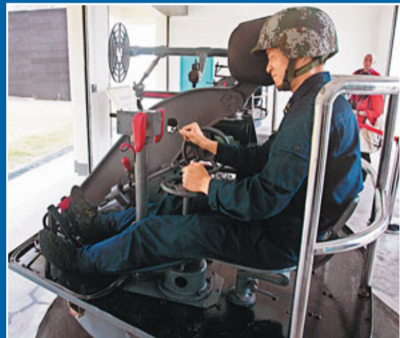
艦炮模擬射擊訓練。