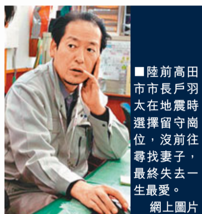
陸前高田市市長戶羽太在地震時選擇留守崗位,沒前往尋找妻子,最終失去一生最愛。

後,妻子的遺體才被尋獲。 限丸談及此事時說,他不能說所有日本人都會如此,但他不會認為這樣的行為「非凡」,因為很多日本人也會這樣做。他說,盡忠職守正是日本文化的一部分,年長一輩也會這樣教導他們:「要把公共責任置於個人責任之上。」 記者問限丸:「如果面臨同樣的處境,你會不會做同樣的事?」限丸沒半點遲疑,斷然回答:「會,不會躊躇。」他認為,一旦身在其位,必須履行職責,犧牲在所不惜。 地震後,限丸的工作遇上重大變化。他取消了很多預約,專門應對震後工作。他和各方代表會面,盡可能解釋日本的情況,恢復市民信心;各方慰問湧至,他以中文撰寫感謝信,親自到香港電台讀出。