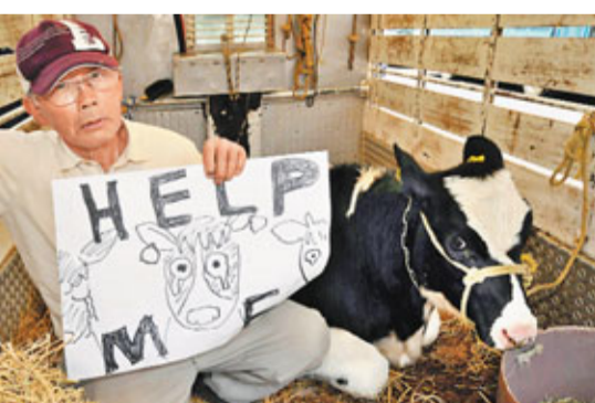
核站周邊地區約200名農戶,昨帶着兩頭牛在東京的東電總部外抗議,要求盡快獲得賠償。

和東電組成的「事故對策統合本部」,昨首次公布根據核站周邊輻射量製作的輻射劑量圖,顯示由於方向不同,核站周邊地區的輻射量存在很大差距,例如西北地區的輻射量仍在增加,西南的卻很低。此外,核站周邊地區約200名農戶,昨帶着兩頭牛前往東京的東電總部門前抗議,要求盡快獲得賠償。