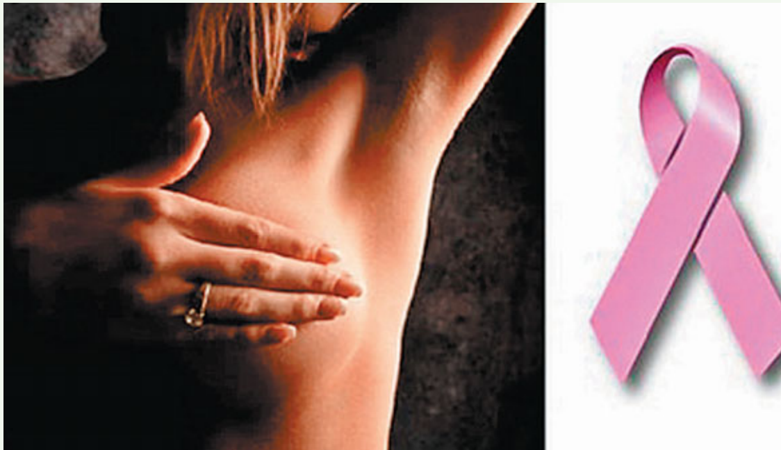
粉紅絲帶已成為保衛乳房、呵護女性健康的形象標誌。網上圖片