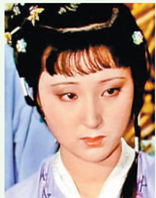
林黛玉扮演者陳曉旭就因乳腺癌病逝。

除乳腺癌外，宮頸癌、卵巢癌、胰腺癌等婦科惡性腫瘤也來勢洶洶。其中宮頸癌發病率排在女性癌症首位，死亡率排女性癌症第四位。2003年底，40歲的梅艷芳因宮頸癌病逝香港。卵巢癌約佔婦科惡性腫瘤15%左右，在女性惡性腫瘤中佔第三位，是造成最高死亡原因的腫瘤之一。香港女首富「小甜甜」——龔如心，就是被卵巢癌奪去生命的。胰腺癌死亡率也極高，被稱為「癌中之王」。2008年2月19日，香港著名藝人