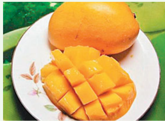
多吃新鮮蔬果，比如芒果，有助於預防乳腺癌。