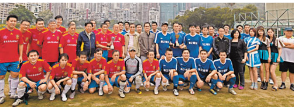
廣東社總和順德青企舉行足球友誼賽，雙方球員合照。

可惜天公不作美，賽事進行時天一直下着微雨，雙方球員在泥地上奔跑都顯得有點吃力。賽事首兩節，雙方球隊雖然盡力搶攻對方龍門，但都是「食白果」。賽事進入最後一節，雙方仍然未能「開齋」，此時天雨卻越下越密，令賽事變成一場體力和毅力的挑戰和