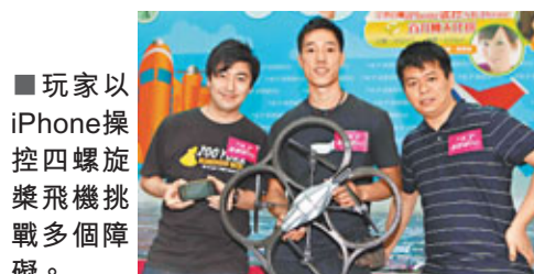
玩家以iPhone操控四螺旋槳飛機挑戰多個障礙。