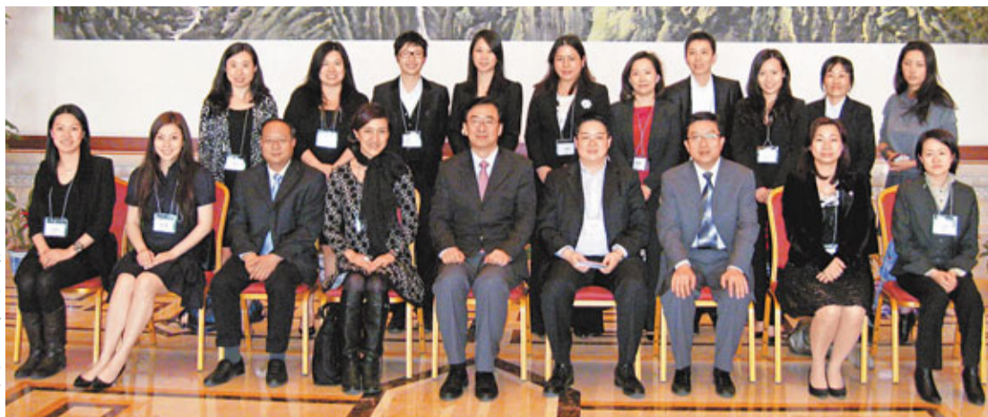
「菁英·領袖之路課程——北京交流學習拜訪團」與中央統戰部領導大合照。

香港文匯報訊(記者 沈清麗)菁英會菁英幟聚於4月14日至17日舉行的「菁英·領袖之路課程——北京交流學習拜訪團」已圓滿結束。交流學習團一行共20人，由菁英會副秘書長兼菁英幟