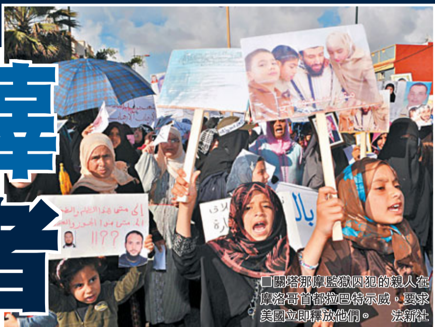
關塔那摩監獄囚犯的親人在摩洛哥首都拉巴特示威，要求美國立即釋放他們。