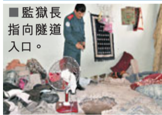
監獄長指向隧道入口。

阿富汗南部坎大哈監獄昨日發生大規模越獄事件，監獄長稱，大批政治犯通過一條長360米的巨大隧道漏夜逃走，其中很多是塔利班成員，當局已捕獲部分越獄者。這次大規模越獄反映阿富汗政府對南部的控制並不牢固。塔利班承認，他們是此事的幕後主腦。該組織發言人稱，囚犯於5個月前挖出地道通向監獄的南部，囚犯前晚11時開始越獄，在昨日清晨結束，並已安全抵達塔利班營地，過程中沒發生戰鬥。該發言人稱，共有541名囚犯成功越獄，所有人均為組織成員，其中106人為塔利班指揮官。