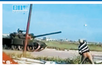
敘利亞軍方坦克駛進南方地區，示威者向坦克擲石塊。

白宮官員表示，美國奧巴馬政府正草擬行政指令，凍結敘利亞政府高層的資產。此外，國際法學家委員會(ICJ)表示，巴沙爾暴力鎮壓示威者，造成大量傷亡；ICJ中東法律官員賽義德稱，該