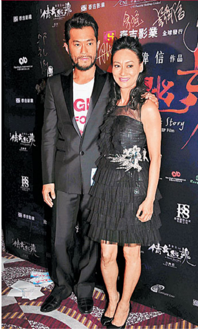
在《倩女幽魂》中，古天樂演的道士燕赤霞和惠英紅演的樹妖姥姥，都被稱不落俗套。