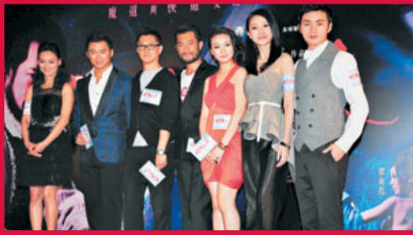
《倩女幽魂》已有「珠玉」在前，新版本的這個新組合能否推陳出新，大家拭目以待。