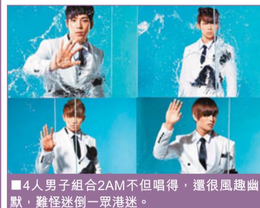
4人男子組合2AM不但唱得，還很風趣幽默，難怪迷倒一眾港迷。

韓國美聲男子組合2AM將於5月26日首度來港，進行三日兩夜的宣傳活動，屆時將會於27日晚在九龍灣國際展覽中心地下展覽廳舉行歌迷聚會音樂會。原本該音樂會的門票是隨他們的《Saint O'Clock》歌迷聚會音樂會特別版CD+DVD附送，由於歌迷反應太熱烈，上星期一推出後，當天下午已銷售一空。據悉有眾多歌迷搶購不到門票，因此有不法商人把附有音樂會門票的CD售價炒高至港幣1050元，掀起炒風。有見及此，是次音樂會主辦方環球唱片為遏止炒風，及感謝歌迷的支持，決定加推少量附有音樂會門票的CD，於明天在各大唱片店發售。