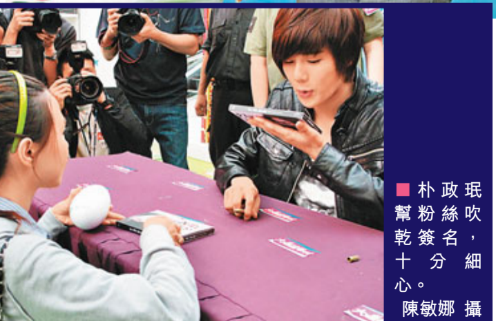
朴政珉幫粉絲吹乾簽名，十分細心。