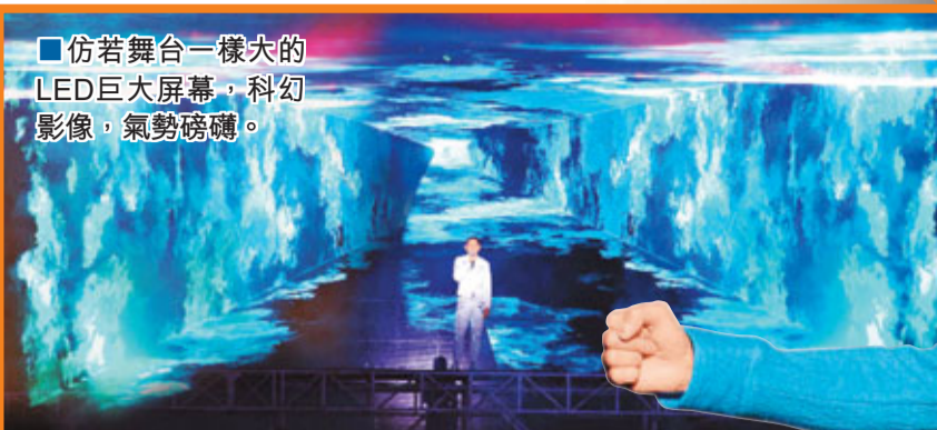
仿若舞台一樣大的LED巨大屏幕，科幻影像，氣勢磅礴。