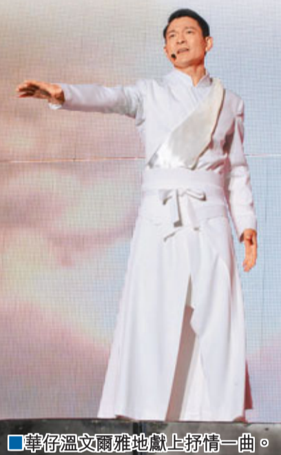
華仔溫文爾雅地獻上抒情一曲。

香港文匯報訊 劉德華世界巡迴演唱會，在內地舉行11場，首場於23日在北京工人體育場舉行，這被北京市民視為一件娛樂大事，交通廣播網特別報道劉德華演唱會消息，要市民避開演唱會附近的路段，以免受塞車之苦。