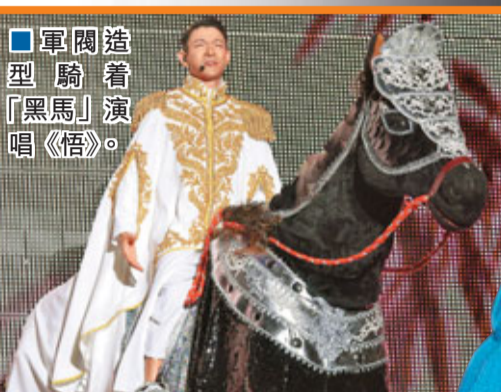
軍閥造型騎著「黑馬」演唱《悟》。