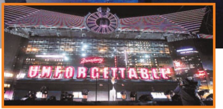
劉德華北京演唱會會場外觀。

內地巡迴演唱會首場北京站就在磅礴、科幻、炫麗、淚水的交織下圓滿的結束。緊接著華仔將繼續為接下來的4/26鄭州、4/30天津、5/4寧波、5/7上海、5/10江陰、5/14長沙、5/18成都、5/22武漢、5/27重慶、5/31泉州等10場馬不停蹄的演出。