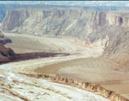
■往天水途中，看到不少劃破平地的 大峽谷。