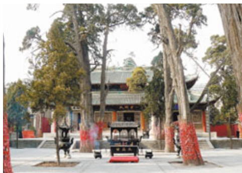
■天水伏羲廟內的主殿