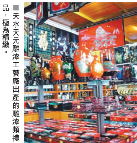
■天水天元雕漆工藝廠出產的雕漆類禮品，極為精緻。

吃過聞名已久的蘭州拉麵，記掛住店上的書畫對聯：「到敦煌方知敦煌盛景耀眼，品拉麵才覺肚溫暖心爽味襲人」，便急急乘車到此行最後一站天水。要經過6、7小時車程才抵達天水，但對第一次踏足此段路的人來講不會悶，沿途不時出現劃破平地、劃破山坡的的大峽谷；看到黃土高坡上的梯田、農舍，為了收集珍貴的雨水及防寒而建的泥牆，單邊屋頂的特色農家四合圍；農民開始在田春耕，與一些畫家筆下的風景畫差不多，讓人感受到極具詩情畫意，簡直是喜歡大西北風情的攝影家及愛寫生畫家的樂土。