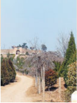
■卦台巍立於高山上，需走一段長斜坡才可到達。