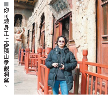
■你可親身走上麥積山參觀洞窟。