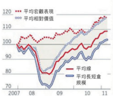
對沖基金業總資產(美元)