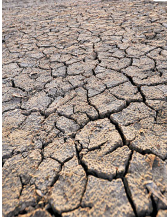
■瑞士格魯耶爾湖部分乾涸，池底的泥土龜裂，遠處停着一艘小艇。

歐洲多國經歷連月乾旱天氣，正面臨百多年以來最嚴重的旱災。各國除擔心旱情持續增加山林大火的危機，更憂慮小麥失收刺激糧價上漲。民眾在今年復活節的願望，大概離不開「求雨」。