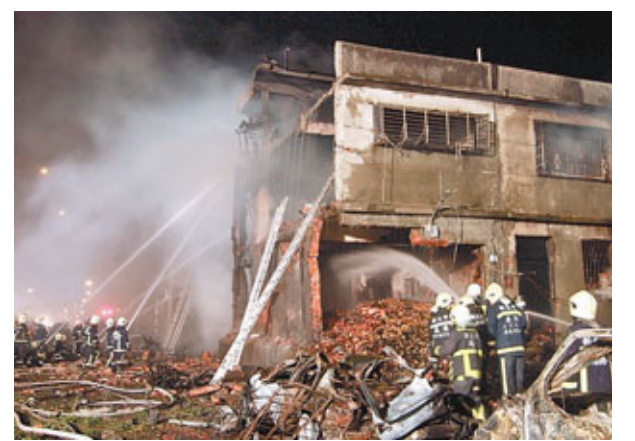
新北市一家金紙廠爆炸，已致4人死亡，消防人員在事故現場滅火。

據中通社23日電 新北市五股區新興堂香舖22日晚突然發生大爆炸，造成4死38傷的慘劇，現場附近200米內的14棟房子全毀，13棟半毀，到處都是斷垣殘壁，停在路邊的汽車全部報廢。新北市長朱立倫在慘劇發生趕至現場安排善後工作，並向死傷者及其家屬表達歉意，同時宣佈市府將會承擔所有醫療費和發放慰問金。