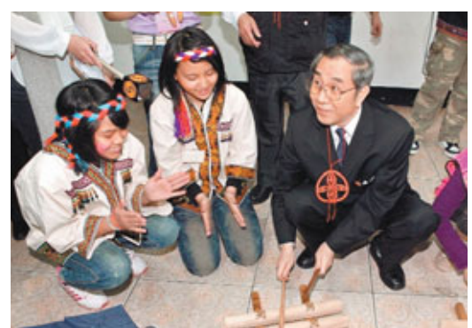
馬靚抵花蓮縣，赴花蓮少數民族兒童之家與孩子們同樂。

在此後的8天中，參訪團將舉辦「2011桂台經貿文化合作論壇」，並與花蓮簽署60多項合作備忘錄、舉辦90多場活動，簽署合同金額將達14.33億美元。馬靚一行還將廣泛拜訪台灣知名人士、企業家。