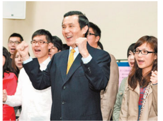
馬英九在「首投族」青年陪同下完成提名登記。學生們高喊「台灣更繁榮、就挺馬英九」。

但有分析指出，自「十八趴」開始，到「骨灰罈」及「核四停商轉」，蔡英文的理性形象已經受損，馬英九大可憑其實際的政績贏得首投族的肯定。另一方面，雖然馬英九近期頻頻走訪各家大學，與學生就公共議題互動，取得良好的「吸票」效果，但其因「恐龍法官」、國光石化等施政引起爭議，仍需進一步鞏固青年票源。