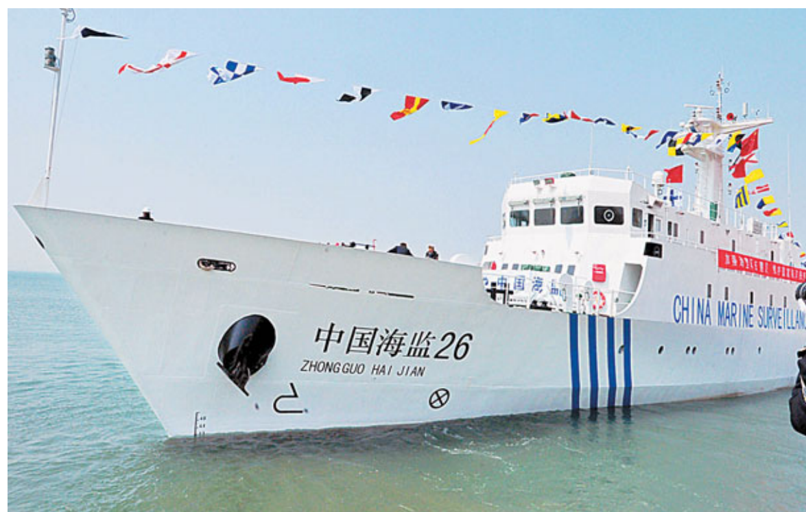
千噸級海監船服役 千噸級巡邏執法船「中國海監26」22日在青島正式列編中國海監北海總隊船舶序列，這也標註著中國海監船舶項目二期工程1,000噸級II型的4艘海監船已全部建造完成並投入使用。據介紹，「中國海監26」船總重1,125噸，最大航速20節，續航力5,000海里，擁有先進的衛星通信和導航設備及全船網絡及監控系統。新華社

《自然》報道又說，這是因為每一個反應堆都有其獨特的風險因素，還有一些純粹不為人知的風險尚待發掘。