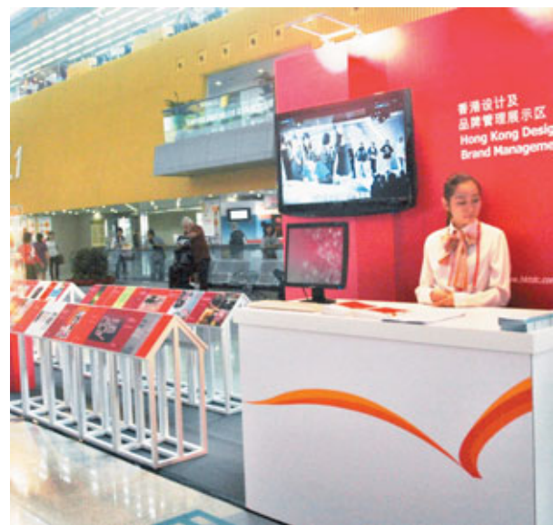
廣交會成立產品設計與貿易促進中心。圖為香港相關機構在廣交會的設計及品牌管理展示區。

汪民介紹，中國地域遼闊，淺層地溫能可利用量巨大。據估算，全國287個地級以上城市淺層地溫能可利用資源量相當於每年3.5億噸標準煤，如有效開發利用，每年可以節約標準煤2.5億噸，減少排放二氧化碳5億噸。