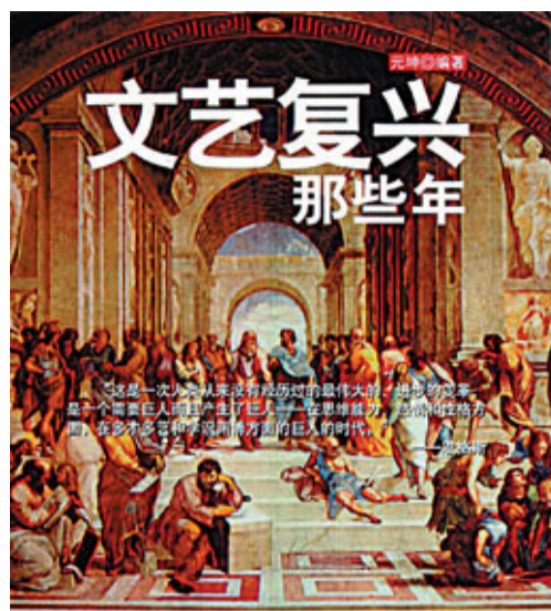
五百年前，那串被壓抑千年的沉重巨雷，刺痛了羅馬，喚醒了歐洲，响彻全球