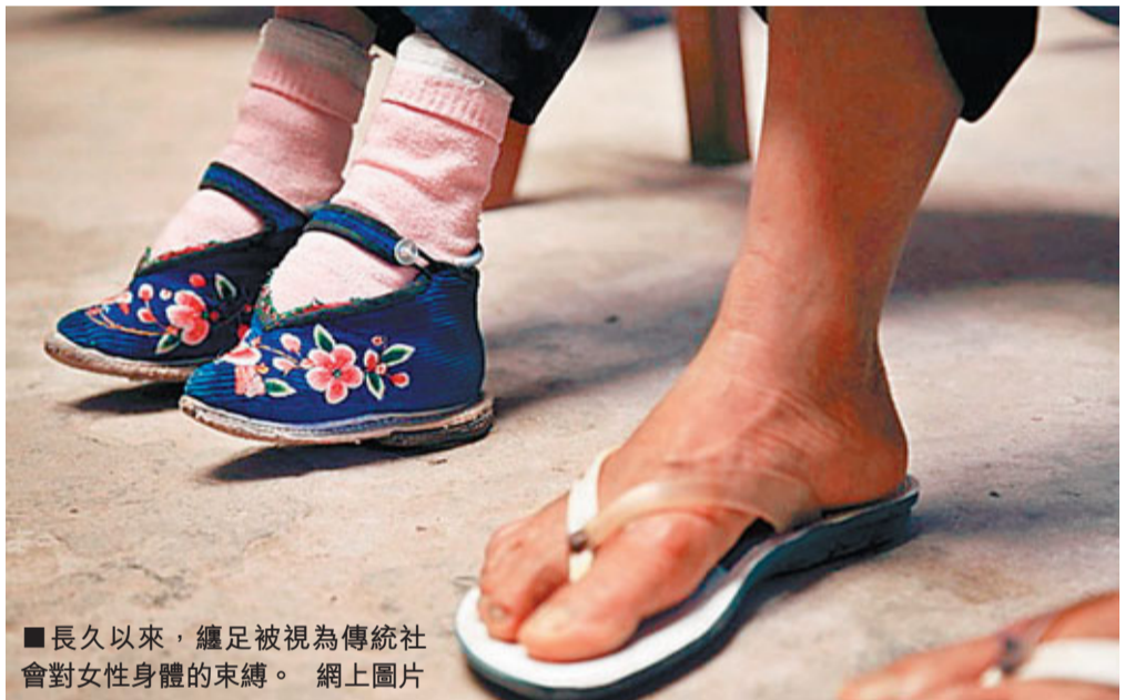
■長久以來，纏足被視為傳統社會對女性身體的束縛。網上圖片

http://www.hkbu.edu.hk/~histweb/genderlens/ (本文由城大中國文化中心提供)