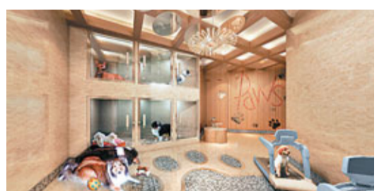
豪華會所Club Casa特設全區獨有的寵物Petsland

豪華會所Club Casa，設有三大主題，包括住客尊區、兒童樂園及全區獨有的寵物Petsland。園林會所面積逾65,000呎，匯聚逾40種享樂設施，包括50米室外泳池、SPA、超級影院、搖滾Band room、寶貝演奏廳、馬可勃羅藏書閣等。而嶄新的寵物Petsland更設優尚酒店、戶外訓練場等應有盡有，24小時全天候開放，玩樂享受，不假外求。