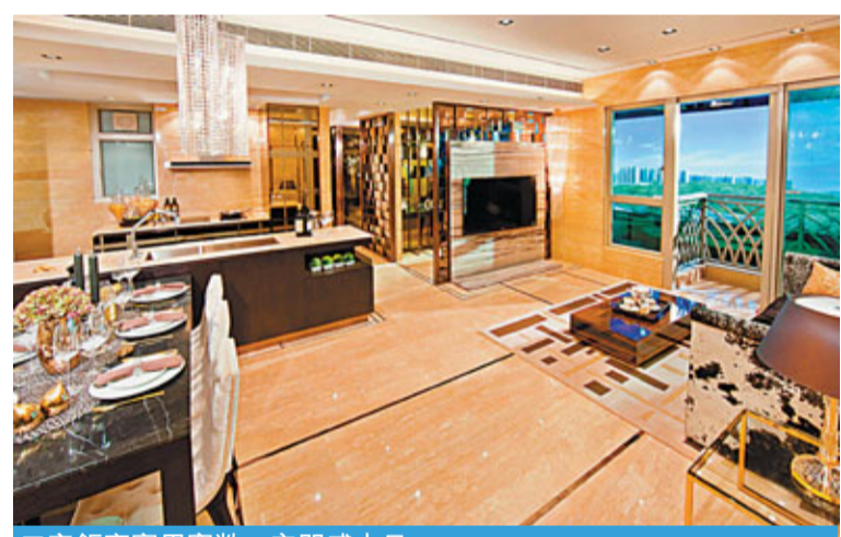
客飯廳實用寬敞、空間感十足。