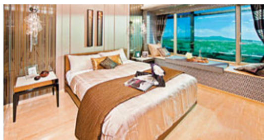
寬闊的主人房景觀開揚

項目以低密度住宅規劃，採用意大利佛羅倫斯古典宮廷建築風格，配合苑苑內外廣闊翠綠的怡人景致，景觀開揚無阻。「UPTOWN尚城」提供697個分層豪華單位，間隔多元化兼具彈性，備有4種間隔：2房2廳、3房2廳連儲物房、4房2廳連儲物房，以及4房2廳連儲物房及化妝間等選擇。同時更建有37幢4房2廳氣派花園大屋，以四房兩廳連儲物房為主，迎合不同用家需求。