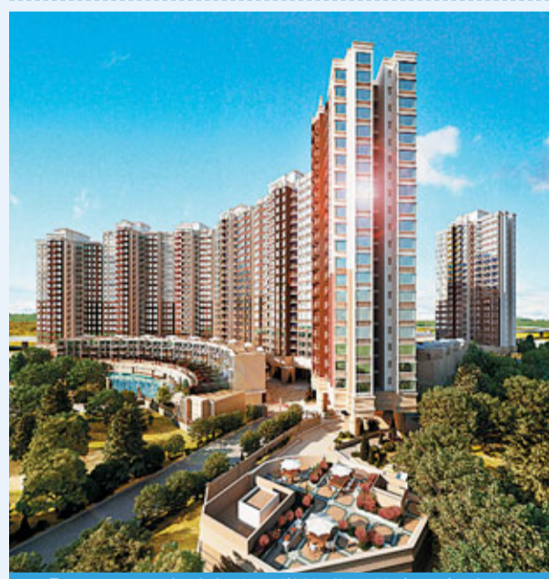
「UPTOWN尚城」位置傲據港深黃金三角地段

「UPTOWN尚城」地理位置優越，其位處近年被喻為「深圳的未來」的前海區，與亞洲金融心臟地帶香港中環的中心點，香港國際機場亦近在咫尺；「UPTOWN尚城」傲據這個由香港中環、香港國際機場以及深圳前海等三大經濟命脈構成的「港深黃金三角」的中心點，佔盡珠三角地區整體發展的先機。近年香港政府更銳意規劃洪水橋為「門廊市鎮」，加入多項大型鐵路及公路發展，與深圳現有及未來的規劃接軌，無限發展潛力不容置疑。