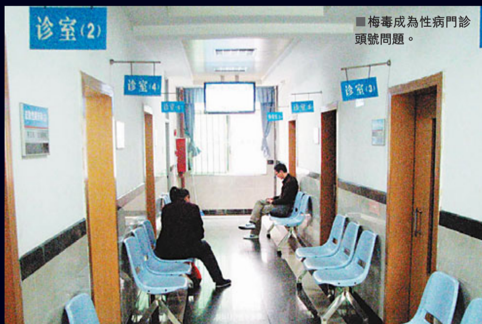
■梅毒成為性病門診頭號問題。

提案分析，「隱性梅毒」無任何臨床症狀。而目前東莞很多孕婦，尤其是流動人口的孕婦，都不注意產前檢查，未能發現該病毒存在。