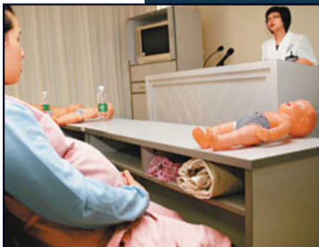
■深孕婦免費篩查梅毒，圖為東莞產科醫生為準媽媽做嬰幼保健輔導。