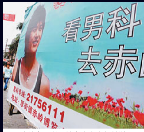
■內地性病猛增，性病廣告大行其道。