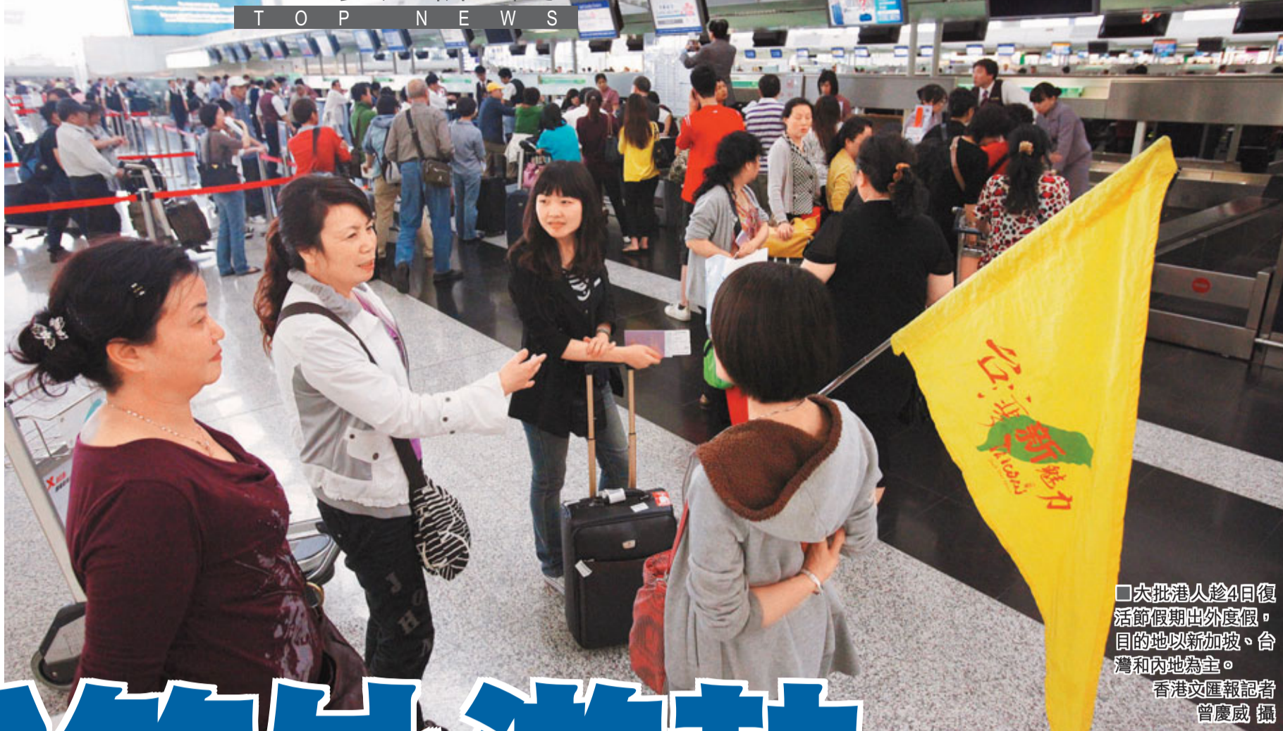
大批港人趁4日復活節假期出外度假,目的地以新加坡、台灣和內地為主。香港文匯報記者 曾慶威 攝

不少市民趁復活節假期首日離港度假,享受假期,香港國際機場昨日上午已人頭湧湧,他們在櫃檯輪候辦理登機手續,當中大部分是一家大小、拖男帶女推着行李箱出發,離境大堂人頭湧湧熱鬧非常。因復活節只有4天公眾假期,短線遊如台灣和新加坡皆為港人首選,其次則是內地省市如上海、北京、昆明等。