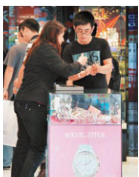
貴價名錶不乏買家。