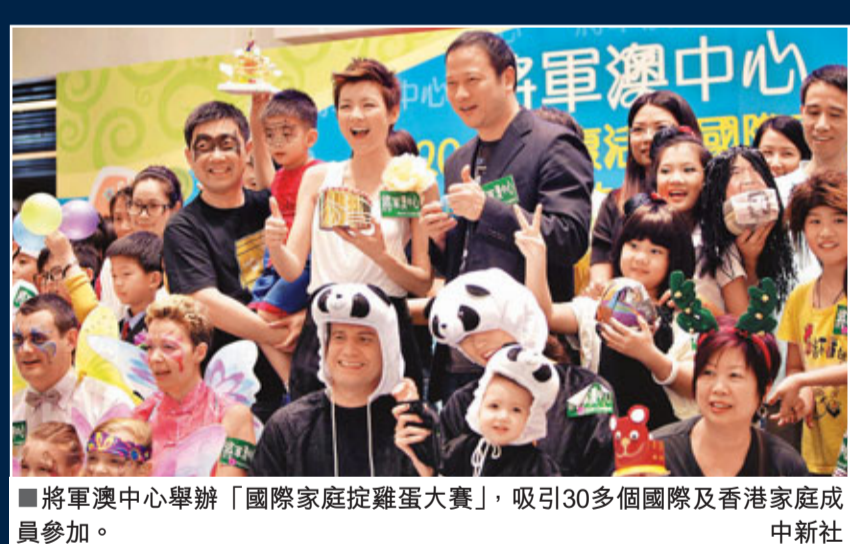
將軍澳中心舉辦「國際家庭捉雞大賽」,吸引30多個國際及香港家庭成員參加。中新社