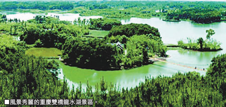
風景秀麗的重慶雙橋龍水湖景區。

展出的鮮花面積近15萬平方米，其中包括動章菊、波斯菊、硫化菊、醉蝶、BIG海棠等海內外特色風情花卉。主辦方還特設5公里觀景道以方便遊客觀賞。據悉，花雕藝術節結束後，雙橋區將繼續保留花雕作品，花卉隨季節不斷更新，形成全國唯一的花雕藝術博物館和常年花卉保留量最大的旅遊景區。