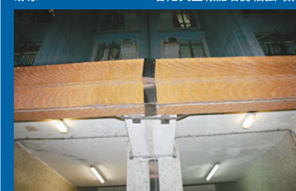
■深水埗白田邨昌田樓及盛田樓，簷篷底部出現裂痕。