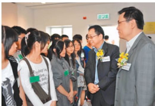
■撲滅罪行委員會委員謝永齡博士（右二）與同學交談，了解他們參加「綠島計劃」的感受。旁為懲教署署長單日堅。

該4項措施包括：一、向獲得不動產後1年內轉售者徵收20%的特別印花稅，而獲得不動產後1年後至2年內轉售者則徵收10%；二、進一步收緊「樓花」貸款比率上限。其中，澳門居民不論樓價，一律定為70%，非澳門居民上限為50%，不設額