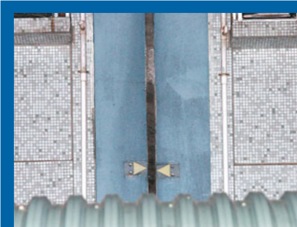
■深水埗白田邨昌田樓及盛田樓，相連位置有移位跡象。

昌田樓與盛田樓2000年入伙，樓齡11年，屬和諧式設計，總共有1,600個家庭入住。