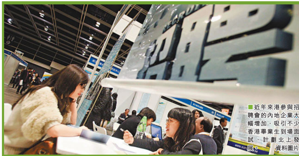
■近年來港參與招聘會的內地企業大幅增加，吸引不少香港畢業生到場面試，計劃北上發展。 資料圖片

香港文匯報訊(記者 馮淑環)踏入4、5月，應屆畢業生陸續展開求職攻勢。隨着內地經濟起飛，有香港院校指內地企業來校作招聘講座較前年多近一倍，願意北上的港生亦有趨升之勢。有人才交流中心指，以往港生的薪酬期望與內地企業落差嚴重，但現時不少人已調節了心態，盼到內地工作爭取經驗，成為將來攀升的「踏腳石」，其中更不乏成功例子：有港生到浙江投身銀行業，1年多後由月薪約7,000港元(下同)的見習管理人員躍升至分行副總經理，最近更獲香港銀行以4萬元高薪挖角，薪酬激增4.7倍，令人羨慕。