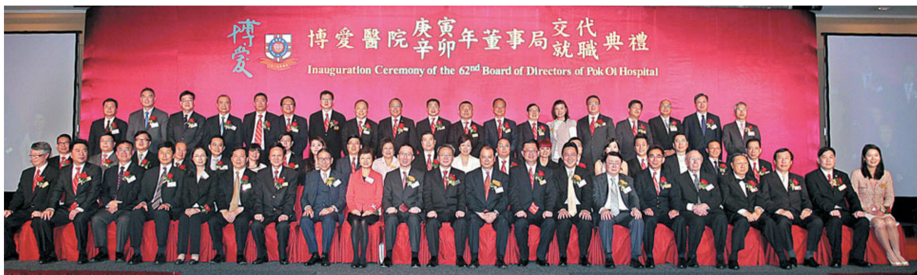
博愛醫院舉行辛卯年董事局就職禮，實主合照。