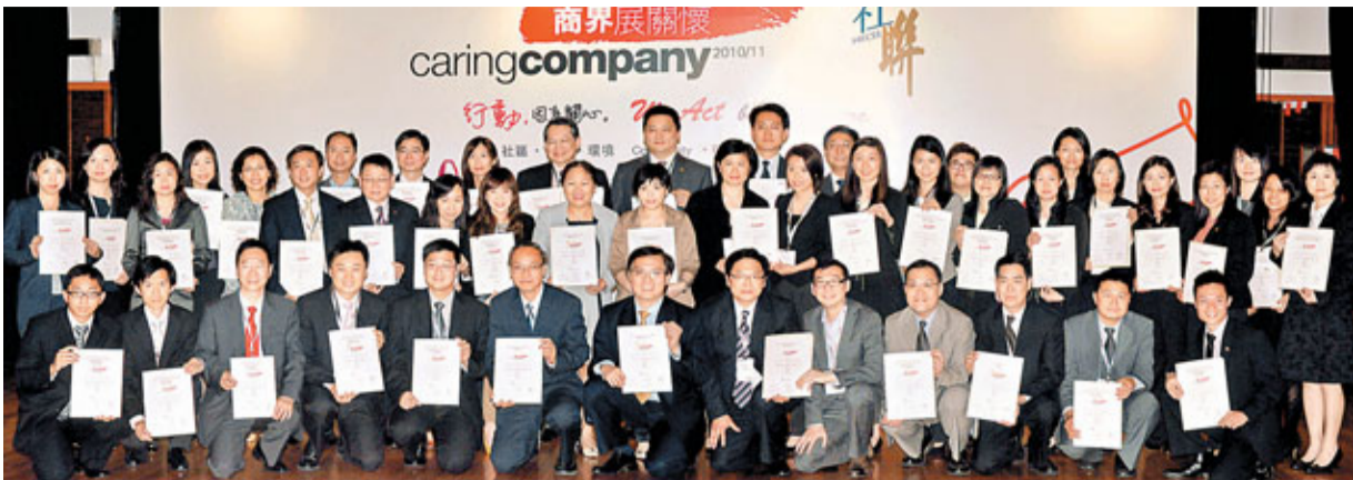
長江集團旗下各集團成員代表於「商界展關懷」嘉許禮上合照。

長江集團則共有92家成員公司獲香港社會服務聯會頒贈「商界展關懷」標誌，連續8年成為最多成員公司獲得