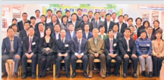
「第30期中國少數民族州長研習班」舉行結業典禮。