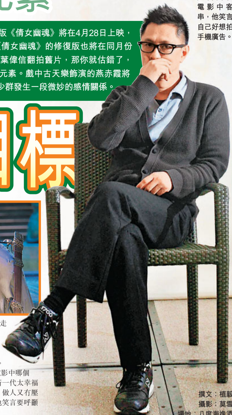
撰文：植毅儀 場地：八度海逸酒店

《倩女幽魂》有個副導演，話唔做就立即唔做走人，拍戲是一個整體工作，做人要有交待，一部戲唔代表一世。現在是好多大學生加入電影行業，但流失率亦好高，100個人入行，只有20人會最後留下來做。我試過問一些新入行的大學生，你想做電影中哪個崗位？但連自己都唔知道自己想點。我想新一代太幸福了，反正唔做咪返屋企，留在房中打機，做人又有壓力。」葉偉信近年間中在電影中客串，他笑言要呼籲各大廣告商找他，自己好想拍手機廣告。