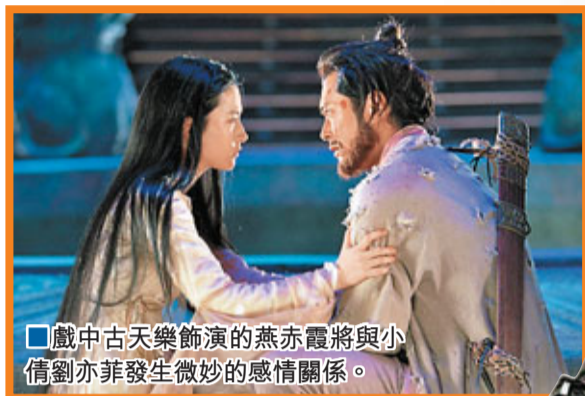
戲中古天樂飾演的燕赤霞將與小倩劉亦菲發生微妙的感情關係。

好友郭子健的《打擂台》在剛舉行的金像獎頒獎禮中成功截擊《狄仁傑》奪最佳電影，這證明新一代的電影人也有出頭天。葉偉信說：「郭子健是一個好肯做的人，當年我和他合作，但話我知有片商找他做導演，我好鼓勵佢出去試下。現在的年青人常說社會唔畀機會他們，但年青一代又嫌辛苦，好似我拍《倩女幽魂》，有個副導演，話唔做就立即唔做走人，拍戲是一個整體工作，做人要有交待，一部戲唔代表一世。現在是好多大學生加入電影行業，但流失率亦好高，100個人入行，只有20人會最後留下來做。我試過問一些新入行的大學生，你想做電影中哪個崗位？但連自己都唔知道自己想點。我想新一代太幸福了，反正唔做咪返屋企，留在房中打機，做人又有壓力。」葉偉信近年間中在電影中客串，他笑言要呼籲各大廣告商找他，自己好想拍手機廣告。