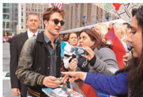
■羅拔幫粉絲簽名，又影合照，態度親民。

荷里活型男羅拔柏迪臣(Robert Pattinson)日前為宣傳與莉絲韋特絲潘(Reese Witherspoon)主演的愛情片《情約奇藝坊》，出席清談節目《The Today Show》，期間他透露首次去馬戲團遊玩時，竟然遇上死亡事件，一位小丑乘坐的座駕突然爆炸，每個人都往外逃走，令他留下深刻的印象。