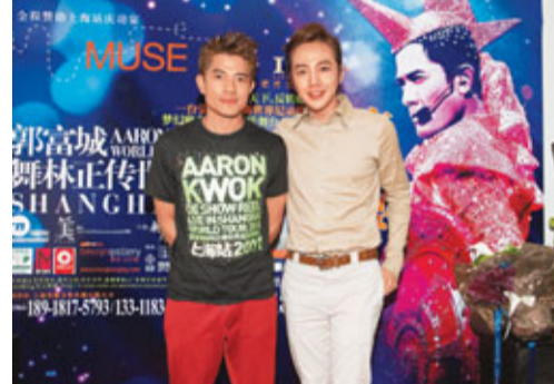
■張根碩(右)喜與城城合影。

韓國花美男張根碩上週赴上海ifc出席與經理人公司HS Media的大中華地區獨家經紀約簽約儀式，宣佈明年全力進攻內地市場外，還趁機欣賞郭富城在上海虹口體育館舉行的演唱會。他表示十分敬佩郭富城在舞台上的高難度舞功，完騷後還到慶功宴會場，向城城要求合影，城城亦大讚他英俊不凡，令他十分開心。