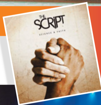
■The Script第2張大碟的創作靈感，部分取材自家鄉愛爾蘭的經濟問題。