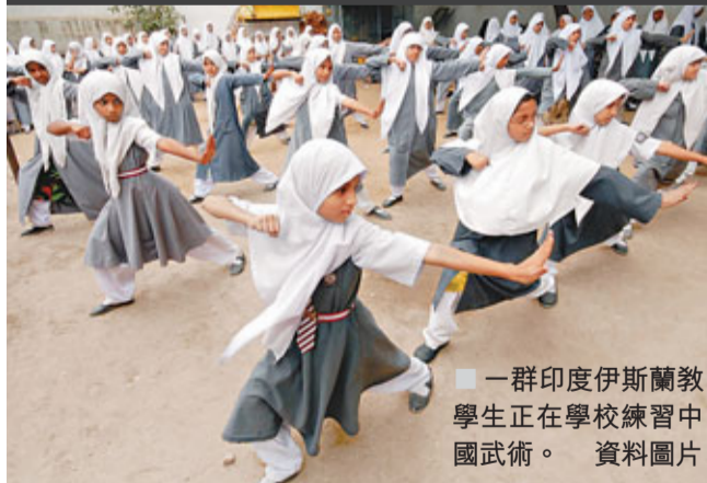
■一群印度伊斯蘭教學生正在學校練習中國武術。

軟實力概念為中國構建大國形象提供新視角。近年，中國領導人開始把提高中國軟實力納入國家發展戰略。在中共中央十七大，胡錦濤總書記指出「當今時代，文化越來越成為民族凝聚力和創造力的重要源泉、越來越成為綜合國力競爭的重要因素」，並首次把提升「國家文化軟實力」寫入有關報告。