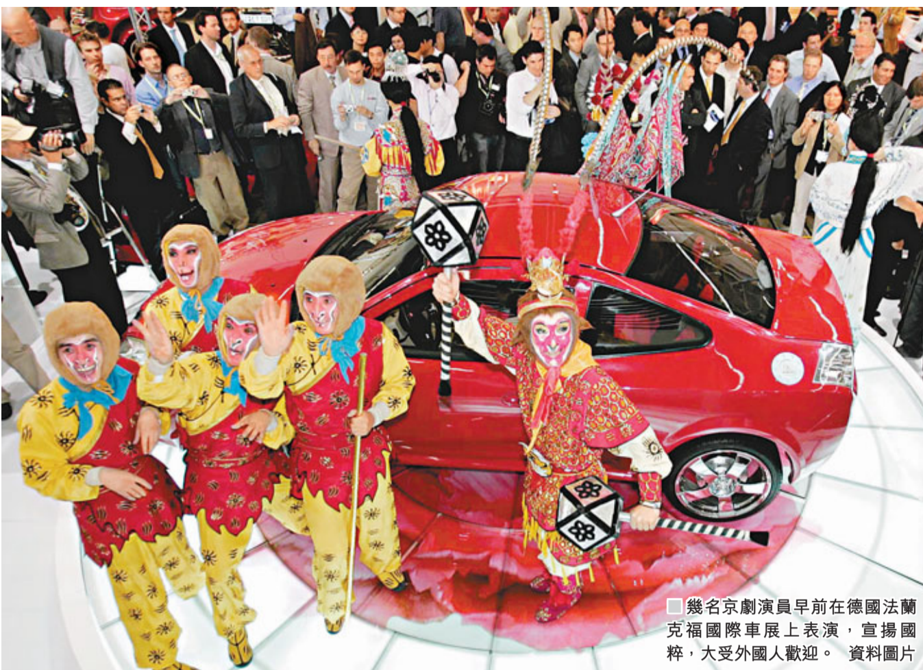
■幾名京劇演員早前在德國法蘭克福國際車展上表演，宣揚國粹，大受外國人歡迎。