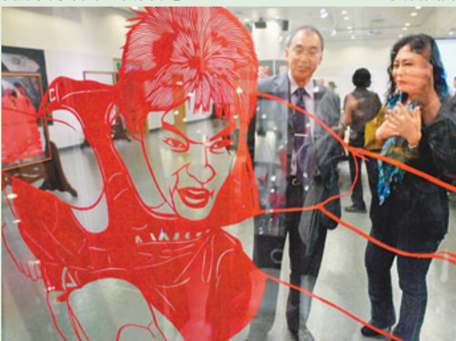
■剪紙藝術是中國的國粹。