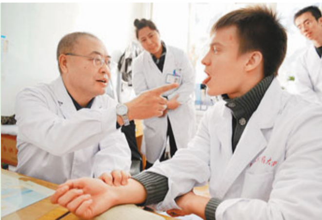
■有人認為中國應更重視中醫研究。圖為一名俄羅斯人正在向中醫學習「望聞問切」。 資料圖片

最後，外交政策而言，中國近年來提出不少新的外交政策，影響周邊國家，這在很大程度上提升了中國的軟實力。中國願意與周邊國家維護共同的安全，促進彼此發展、繁榮和穩定，中國亦把與鄰國共同繁榮當成自身發展戰略的一部分。這些新政策贏得周邊國家的讚賞，在一定程度上緩解所謂「中國威脅論」，而出現「中國機遇論」的呼聲。有東南亞國家甚至希望中國可承擔地區更多的領導責任。