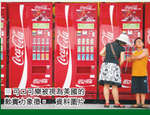
■可口可樂被視為美國的軟實力象徵。

最後，中國需培育更多非政府組織來建構軟實力。目前，中國軟實力的推動以政府為主導，缺乏民間參與。有人認為這是制約中國軟實力發展的轉頭。