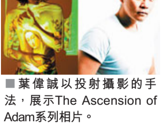
■葉偉誠以投射攝影的手法，展示The Ascension of Adam系列相片。