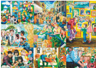
■凡捐款10元或以上，即可獲贈以八位本地藝術學生得獎畫作而設計的慈善明信片。