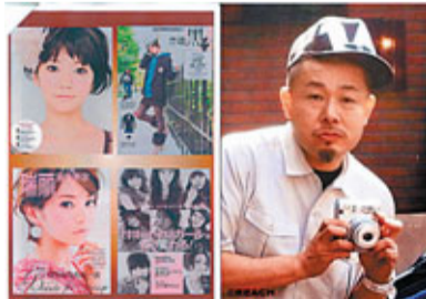
■米原康正會在港為捐款人作snap shot拍攝。

早前由日籍攝影師米原康正發起、在日本取得空前成功的「1 snap for LOVE」慈善攝影日，將會移師香港，於4月23日，下午1時正式舉行，屆時米原康正將親自來港主持，每位到場者只需即場捐款港幣50元，米原康正將會公開為捐款人拍攝snap shot照片，每位捐款者都可以成為米原康正大師鏡頭下的模特兒，更可與日本雜誌人氣模特兒合照。此外，部分展品設慈善義賣，義賣底