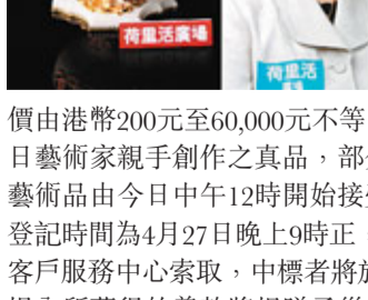
價由港幣200元至60,000元不等，全部皆為參與聯展港日藝術家親手創作之真品，部分擁有證書。慈善義賣藝術品由今日中午12時開始接受暗標競投登記，截止登記時間為4月27日晚上9時正，登記表格可到場內1樓客戶服務中心索取，中標者將於4月30日獲個別通知，場內所募得的善款將轉贈予災後心理輔導協會的「災後心靈重建計劃」。文：盧寶迪

「日本再誕生Reborn—The Gallery」 復活節慈善藝術聯展 展期：即日起至4月27日 (中午12時至晚上9時) 地點：鑽石山荷里活廣場1樓明星廣場