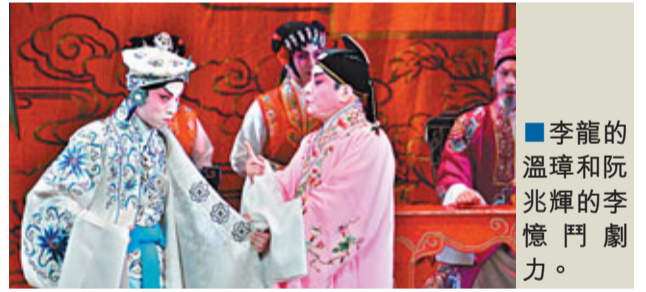
李龍的溫璋和阮兆輝的李憶門劇力。