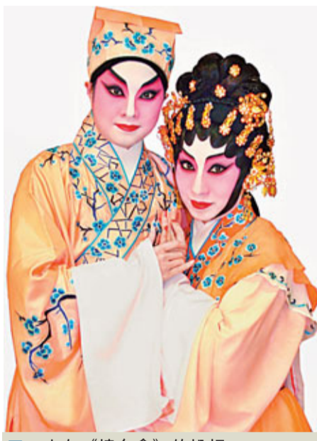
二人在《樓台會》的扮相。