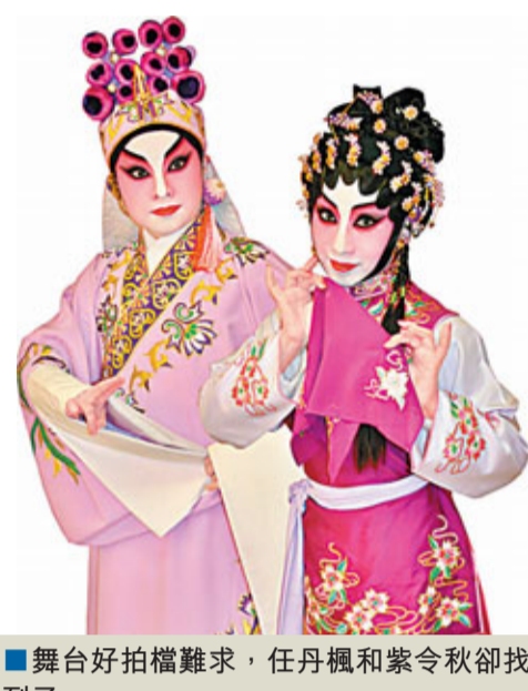
舞台上好拍檔難求，任丹楓和紫令秋卻找到了。