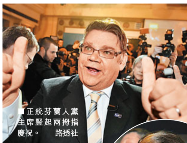
■正統芬蘭人黨主席豎起兩指慶祝。

歐洲債務危機重燃！歐盟和國際貨幣基金組織(IMF)官員討論救助葡萄牙問題之際，前天芬蘭國會選舉出現爆冷結果，第2和第3大黨地位都落入疑歐派手上，大有可能成為執政聯盟黨派，他們已表明阻撓救助葡國。此外，市場猜測希臘將重組債務，連串不利消息令財政疲弱的歐元區國家壓力驟增。近日升勢強勁的歐元轉勢，兌美元跌至近10天低位，昨報1.4332美元。