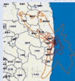
第一核電站事故發生後，日本政府

又一日日本政府處理核災難手法被炮轟的例子！共同社昨日獲悉，福島第一核電站事故發生後，日本政府的「緊急時輻射影響迅速預測網絡系統」(SPEEDI)繪製了2,000餘張輻射擴散模擬圖。SPEEDI的開發和運作費高達128億日圓(約12.1億港元)，是為了在核站事故發生後能夠採取有效疏散措施而開發，可是，管理該系統的原子能安全委員會，在事故發生後僅公布了2張圖(見圖)。 ■共同社