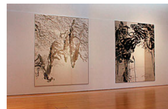
■潘公凱大型水墨畫作品

時間：即日起至5月22日 上午10時至下午7時 (逢周一休館) 地點：澳門回歸賀禮陳列館 查詢：(853)8791 9814