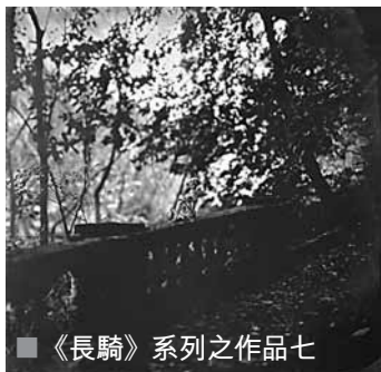
■《長騎》系列之作品七

區：這個主題是想表達一種生活的無奈吧，是對生活中不開心、不公平之處的情緒抒發，我想傳達的是一種感覺。長騎，顧名思義——騎在牆上，不管是對未來充滿遐想，還是對未來不知所措，現在都只能在這臨界線上長騎下去。「牆」在生活中，也許是最普通、最不起眼的事物，但其實是它把我們從居住的地方分割出去，牆外的土地在不停發展，那麼或許我們有一天要站在牆上，才能窺見家園。