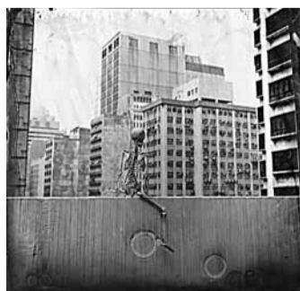
■《長騎》系列之作品五

時間：即日起至4月24日 上午11時至下午7時 (星期一閉館) 地點：光影作坊 (石硤尾白田街30號L2-10) 查詢：3177 9159