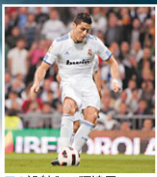
■C朗射入12碼追平。

西甲聯賽榜首大戰兼「國家打吡」和局終場，踢少一人的皇家馬德里主場1:1逼和榜首的巴塞羅那，雙方維持8分差距。在今仗中不單止問題多多，失控事件亦不少，在比賽的第91分鐘，在沒有可能控球的情況下，巴塞王牌美斯突然失控，狠狠地一腳將皮球省向距離他不遠的「馬迷」看台上。