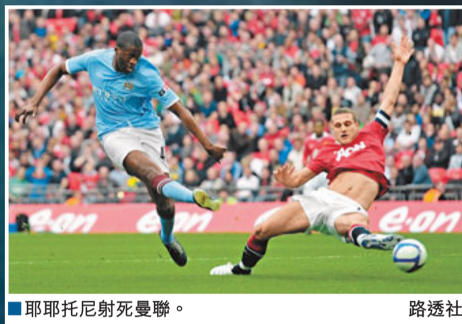
■耶耶托尼射死曼聯。

這位脾氣古怪的意大利小將在賽後先是將自己的衣服扔向曼聯球迷，接着又向對手們擠眉弄眼，結果惹惱了曼聯球員，特別是李奧費迪南和安達臣；李奧費迪南一心要找巴洛迪利「理論」，幸好被隊友以及曼城工作人員攔住。儘管巴洛迪利又惹事生非，但贏球後心情很好的曼城主帥文仙尼似乎並不打算對他進行處罰。李奧賽後批評巴洛迪利向曼聯球迷挑釁，所以令他非常不滿。