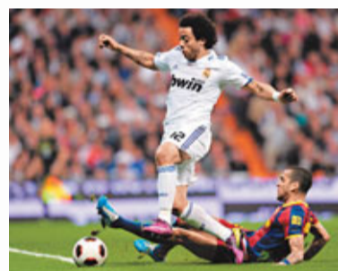
■丹尼爾勾跌馬些路。