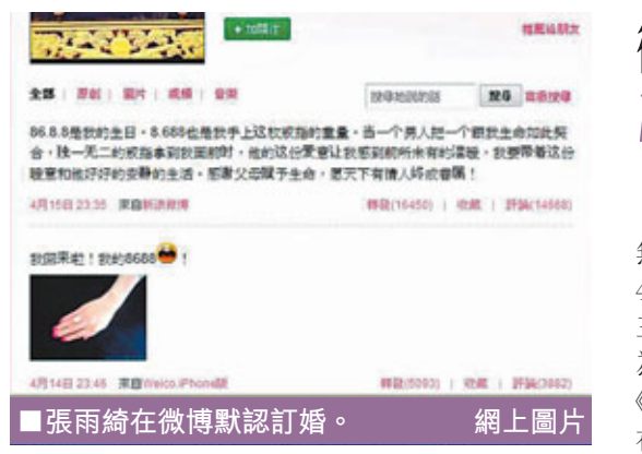
■張雨綺在微博默認訂婚。