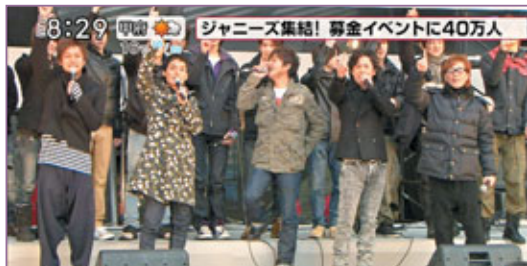
■SMAP早前與一眾師兄弟出席「Matching J」救災計劃。

早前日本發生大地震，擁有SMAP、嵐、NEWS等當紅偶像的尊尼事務所於本月初在東京代代木第一體育館舉行一連三日的「Matching J」募捐活動，因旗下藝人均鼎力支持，吸引約39萬名粉絲前來支持，但上星期尊尼事務所向官方粉絲俱樂部的會員發了一封公開信，指責部分粉絲在募捐活動時，將垃圾、鈕扣、硬幣等東西扔進募捐箱，令有心捐錢的粉絲受到影響，亦有粉絲插隊，斥他們的行為失禮。尊尼事務所還透露近日有粉絲將他們送給災區粉絲、附有藝人簽名的會報放在網上拍賣，強調這種行為不可取。