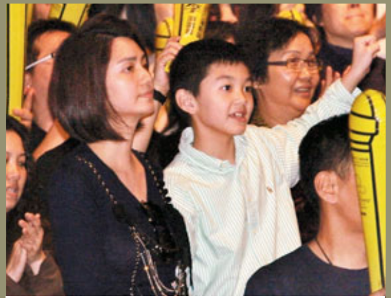
■莫少聰曾自資拍片鼓勵大家追求夢想，想不到自己卻淪落毒海。資料圖片

莫少聰發生今次事件令熟悉他的人都意外，他是佛教徒，將事業基地轉移返內地近十年，08年表示將在北京成家立室。他曾自資四百萬元，花三年時間製作紀錄片《少聰心靈日記—堅持與夢想》。2010年青海省發生大地震，他與張家輝、鄭秀文及導演劉國昌往災區探訪；同年12月他出席著名音樂人小柯的發佈會時表示，公益事業是所有人的事情，每個人不問回報去做，社會就會越來越好，人也會越來越快樂，未來他會繼續做下去，不管哪裡，只要需要他，一定會全力以赴。如此熱心公益的藝人竟淪落吸毒，令人疑感兼惋惜。