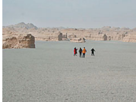
■敦煌雅丹地貌，大海中乘風破浪的艦隊。