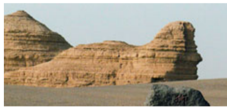
■埃及的獅身人面像在敦煌出現