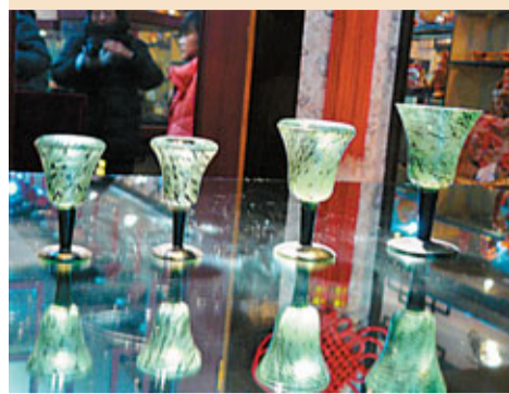
■揚名天下的「夜光杯」