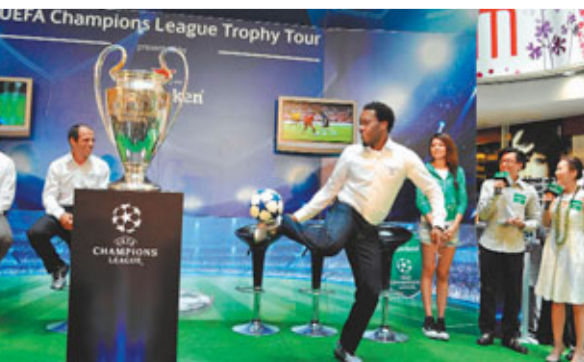
展示球技 前意大利球王蘇拿(左2)與尼日利亞球星奧高查(前)昨日出席在觀塘apm商場舉行的最後一站歐聯獎盃世界巡迴展,二人除即席展示球技還進行簽名會。