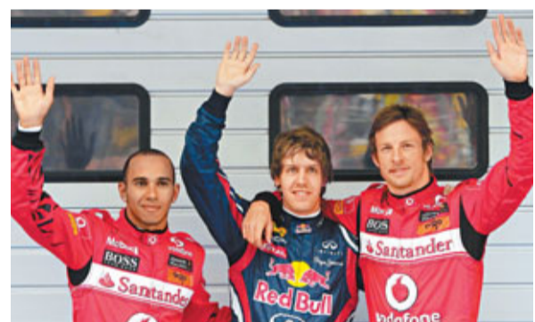
維泰爾(中)力壓一對麥拿命車手威美頓(左)和畢頓再排頭位。

香港文匯報訊(記者 章蘿蘭 上海報導) 紅牛車隊的維泰爾如今牛氣沖天,在昨日進行的F1中國大獎賽排位賽中,以1分33秒706領先第2名多達0.7秒奪得三連桿。若今日發揮正常,維泰爾將創造中國賽歷史,成為首位能夠兩度問鼎冠軍獎盃的車手。不過,對紅牛車隊而言,昨日的比賽可謂喜憂參半,另一位紅牛車手韋伯在排位賽