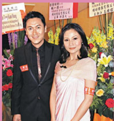
這陣子大家都知道，成功的馬德鐘背後，有個能言會道的太太。