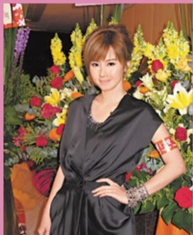
糖兄妹雙入對，成了特色的組合。